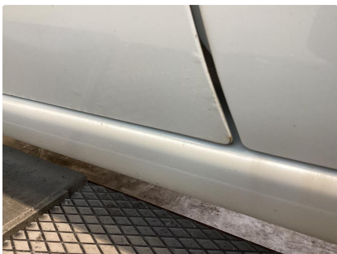
1.1 Bilen har noe rust og bruks merker