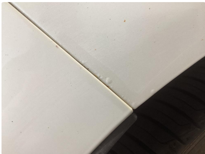
1.1 Bilen har noe rust og bruks merker