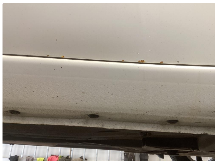
1.1 Bilen har noe rust og bruks merker