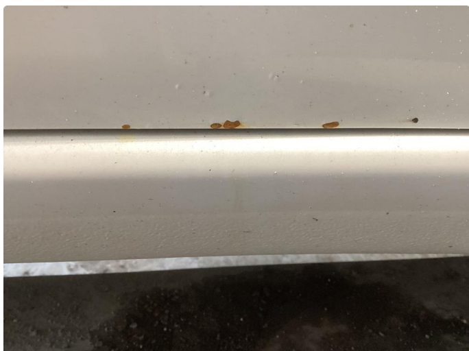
1.1 Bilen har noe rust og bruks merker