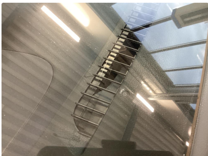
1.3 Slitt frontrute med flere kraftige steinsprut og avskallinger