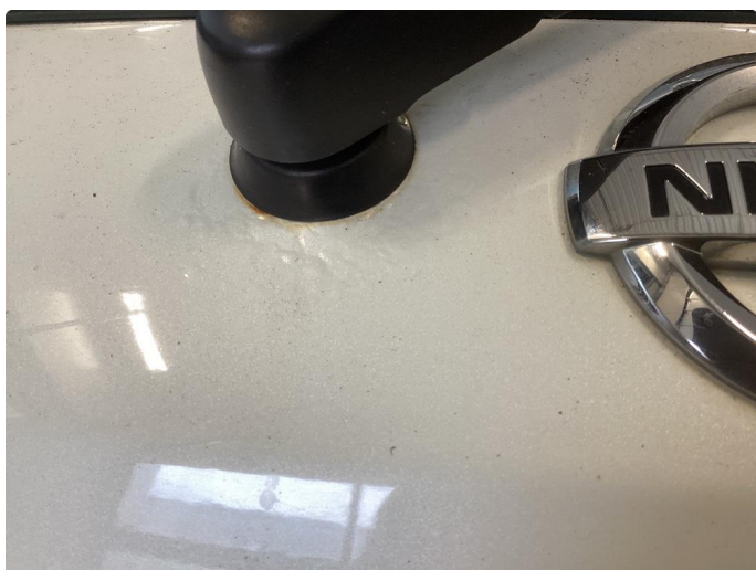
1.2 Mye rust bakluke ved visker arm