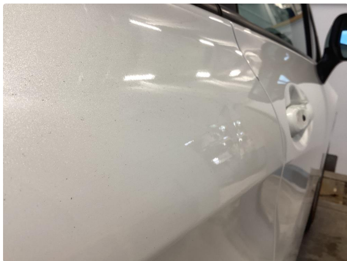
1.1 Bilen har noe rust og bruks merker