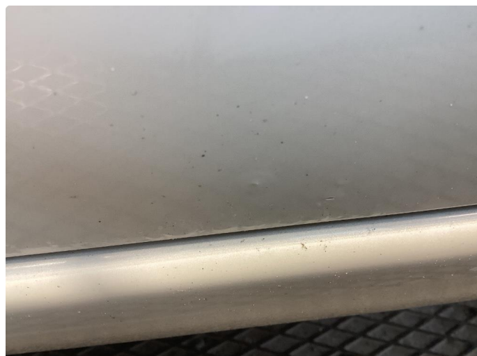
1.1 Bilen har noe rust og bruks merker