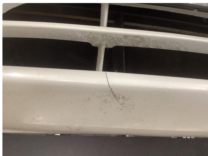
1.1 Bilen har noe rust og bruks merker