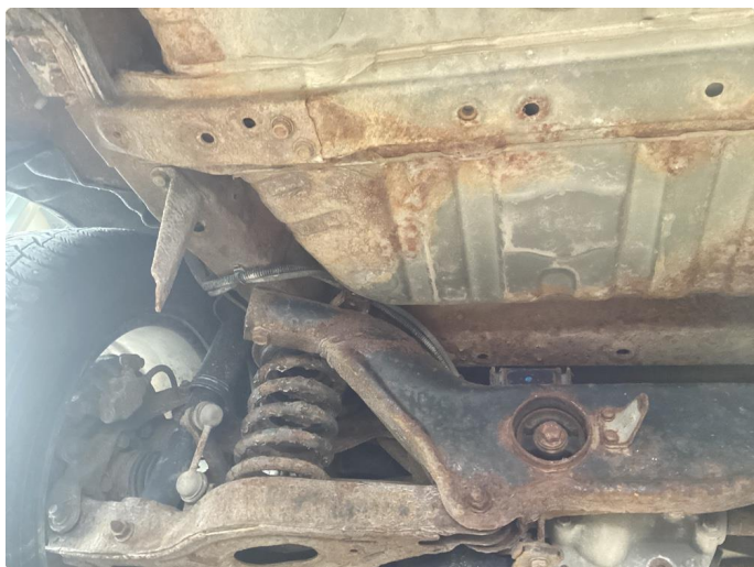
1.3 Rust under bilen