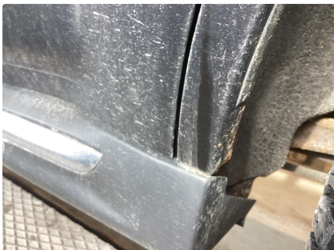
1.1 Div riper, knast og rust karosseri