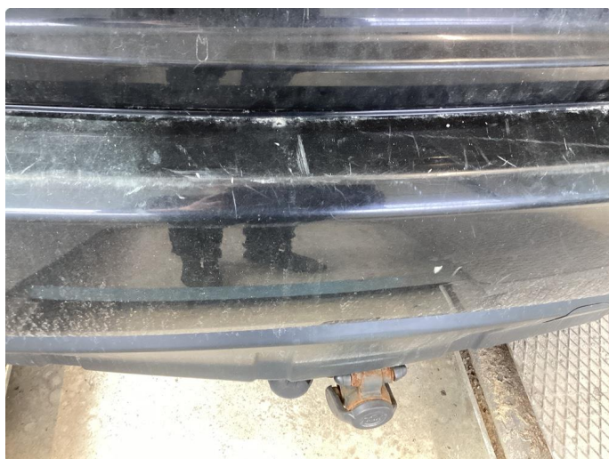
1.1 Div riper, knast og rust karosseri