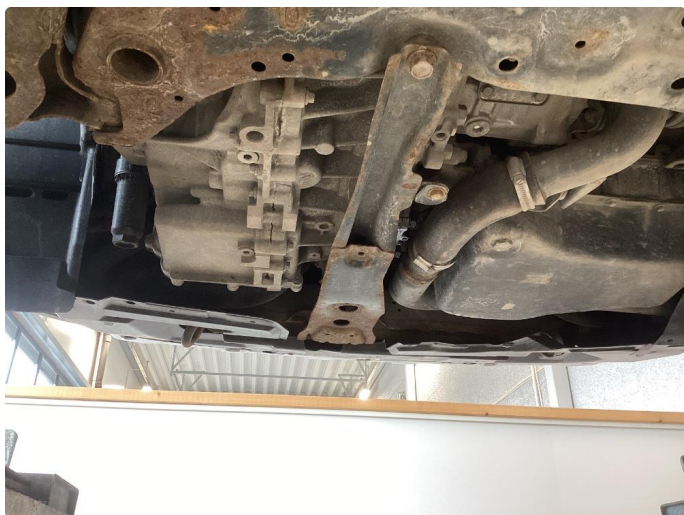
1.2 Beskyttelsesplate skadet/mangler