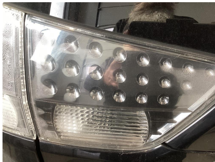
2.2 Noe fukt i alle 4 baklykter og veldig krakkelert/sprekker