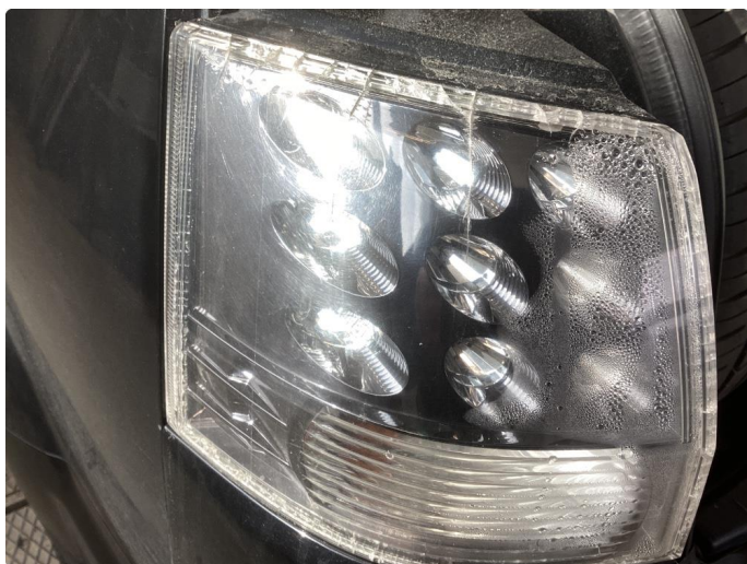
2.2 Noe fukt i alle 4 baklykter og veldig krakkelert/sprekker