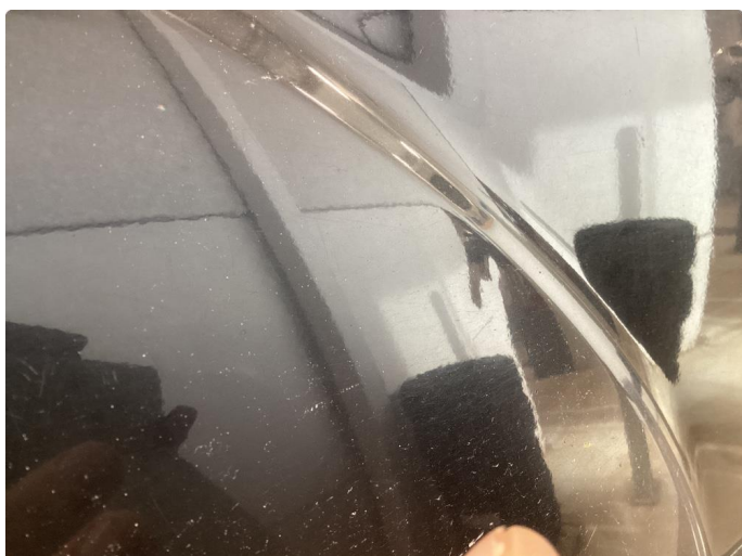
1.1 Div riper, knast og rust karosseri