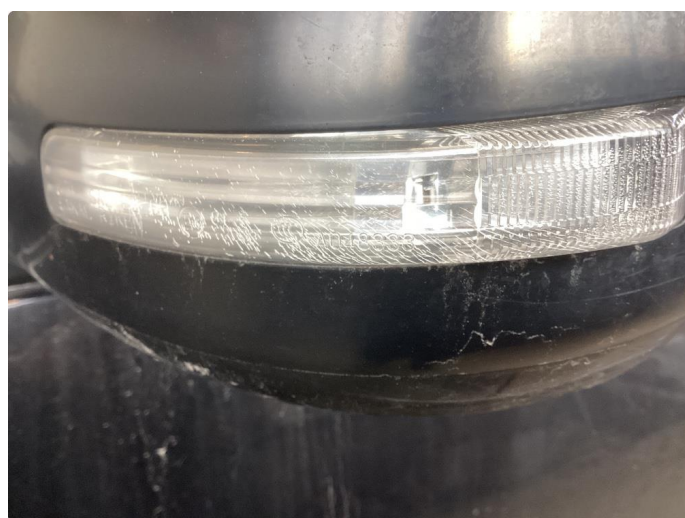
2.4 Noe krakkelerte blinklys i sidespeiler