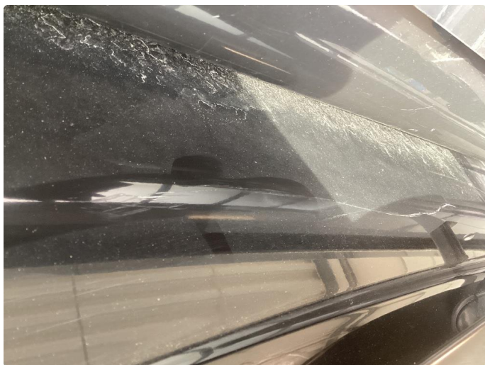
1.1 Div riper, knast og rust karosseri