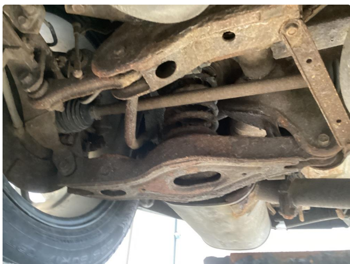
1.3 Rust under bilen