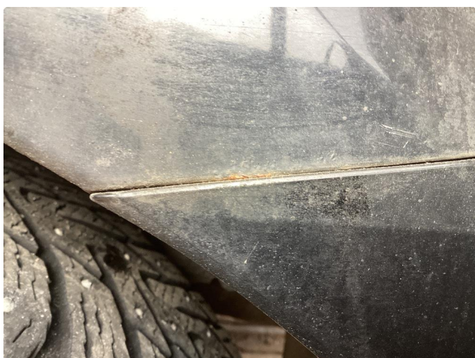
1.1 Div riper, knast og rust karosseri