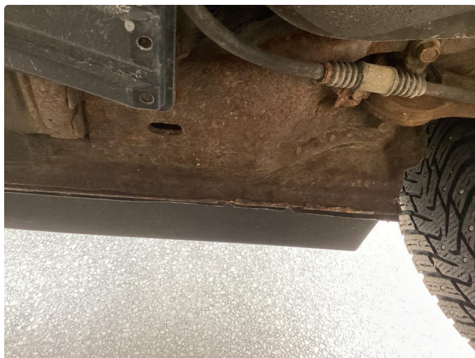
1.3 Rust under bilen