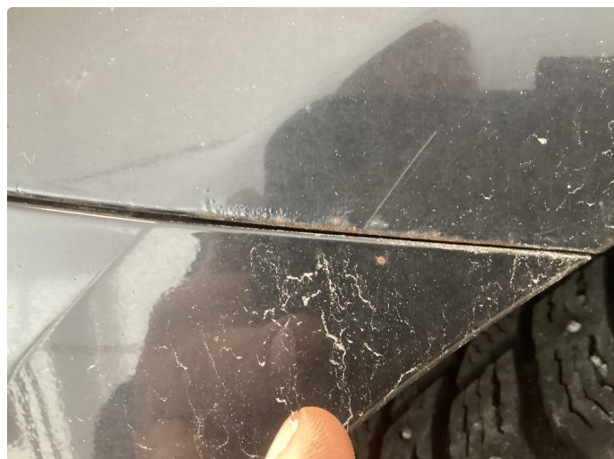
1.1 Div riper, knast og rust karosseri