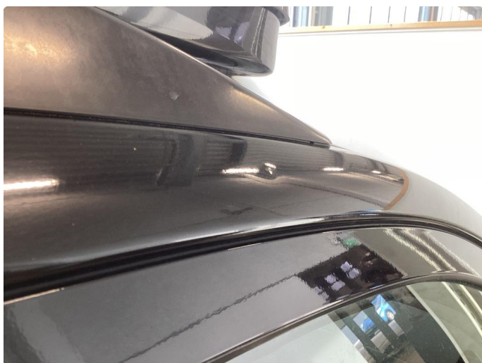
1.1 Div riper, knast og rust karosseri