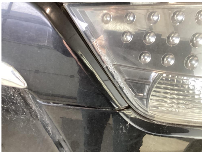
2.2 Noe fukt i alle 4 baklykter og veldig krakkelert/sprekker