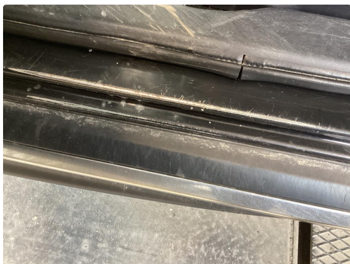
1.4 Slitt innsteg dører, spesielt venstre fordør