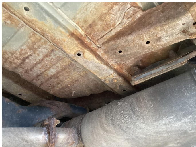
1.3 Rust under bilen