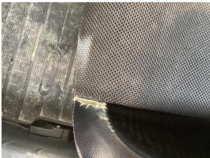
3.1 Sprekk i trekk sittepute førerstol