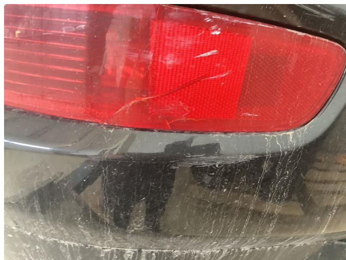
2.3 Sprekt glass høyre tåkelys i fanger bak