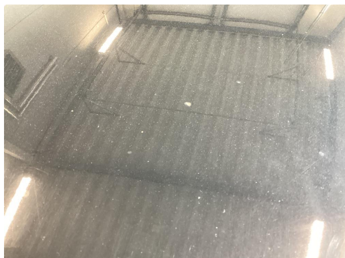
1.1 Div riper, knast og rust karosseri