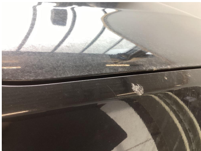
1.1 Div riper, knast og rust karosseri