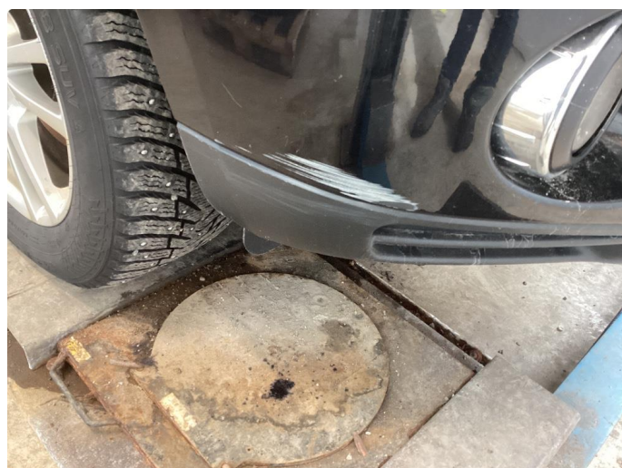
1.1 Div riper, knast og rust karosseri