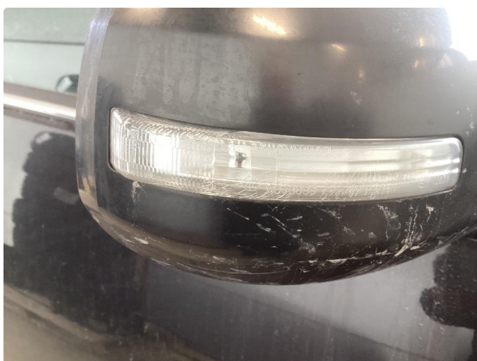
2.4 Noe krakkelerte blinklys i sidespeiler