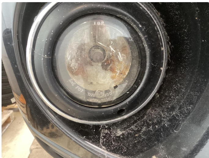
2.1 Defekt reflektor i høyre spreder foran