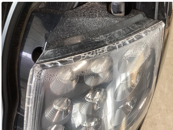
2.2 Noe fukt i alle 4 baklykter og veldig krakkelert/sprekker