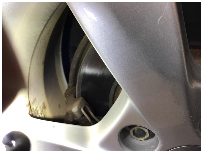
1.4 Noe oksidering inside vinterfelger og noe misfarget felger