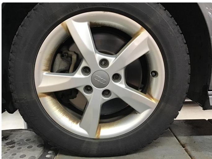
1.4 Noe oksidering inside vinterfelger og noe misfarget felger