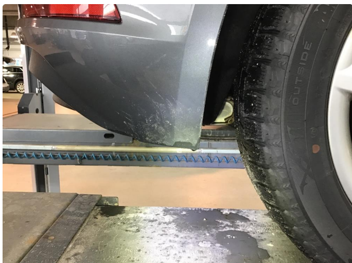
1.1 Matt/slitt lakk kanalskjørter og støtfanger bak.