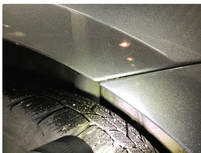
1.3 Påbegynnende rust begge bakskjermer mot støtfangerkant. Rustboble hjulbue høyre side