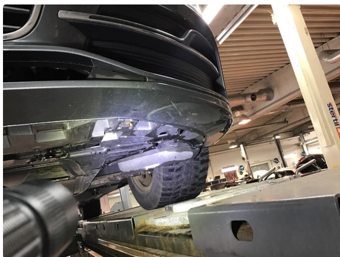
1.7 Noe riper underside støtfanger foran.