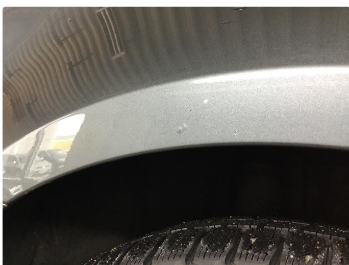
1.3 Påbegynnende rust begge bakskjermer mot støtfangerkant. Rustboble hjulbue høyre side