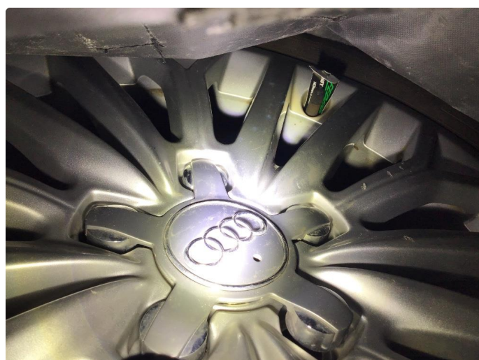
1.5 1 sommerfelg flasser i klarlakk , noe småmerker i de andre.