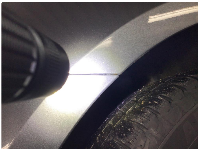
1.3 Påbegynnende rust begge bakskjermer mot støtfangerkant. Rustboble hjulbue høyre side