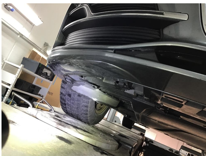
1.7 Noe riper underside støtfanger foran.