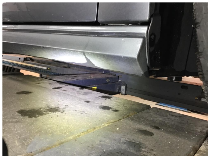
1.1 Matt/slitt lakk kanalskjørter og støtfanger bak.