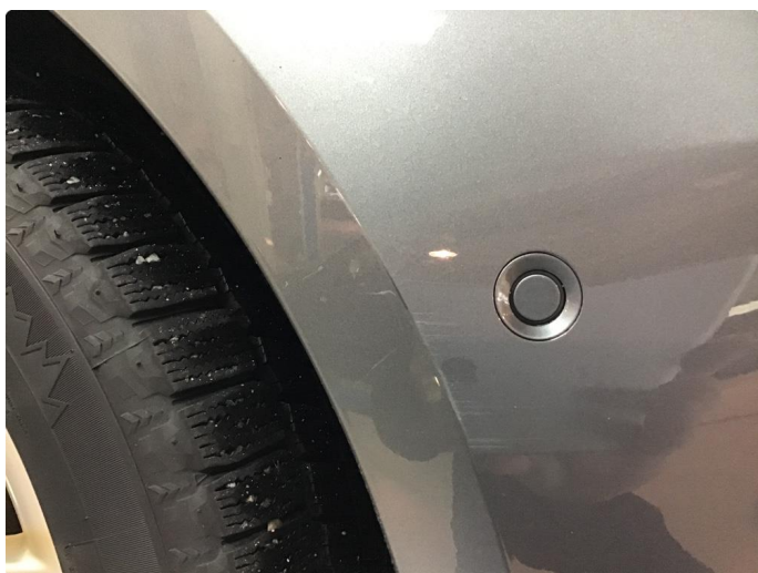
1.6 Småriper venstre side bak