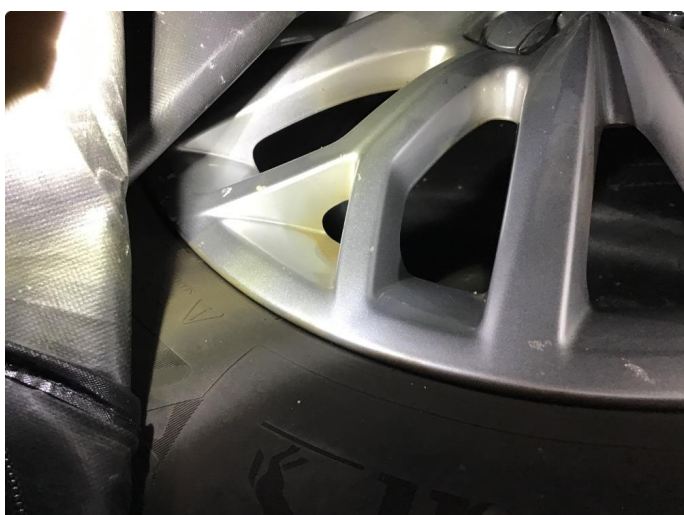
1.5 1 sommerfelg flasser i klarlakk , noe småmerker i de andre.