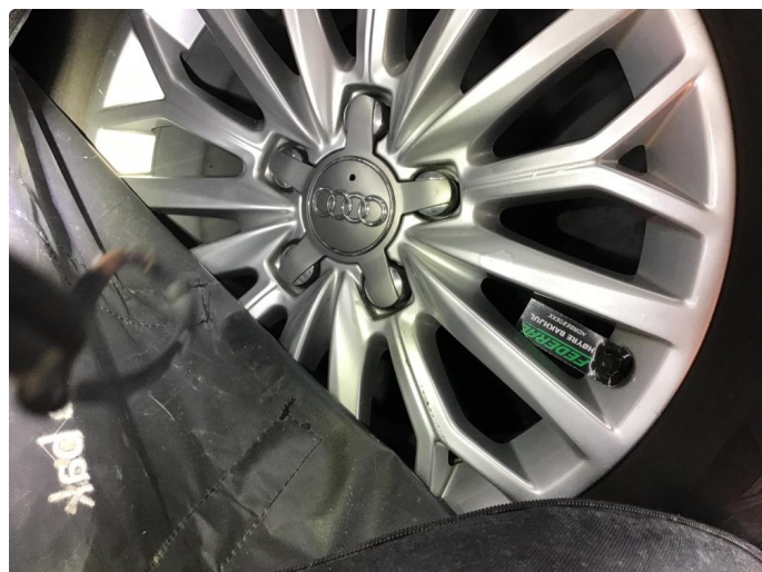
1.5 1 sommerfelg flasser i klarlakk , noe småmerker i de andre.