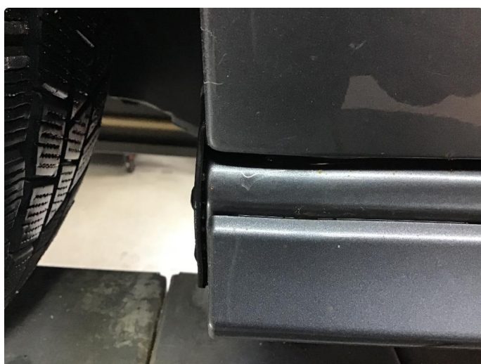
1.9 Rustboble kanal venstre side foran