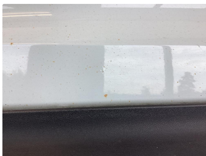
1.3 Noe sinkslipp alle dører