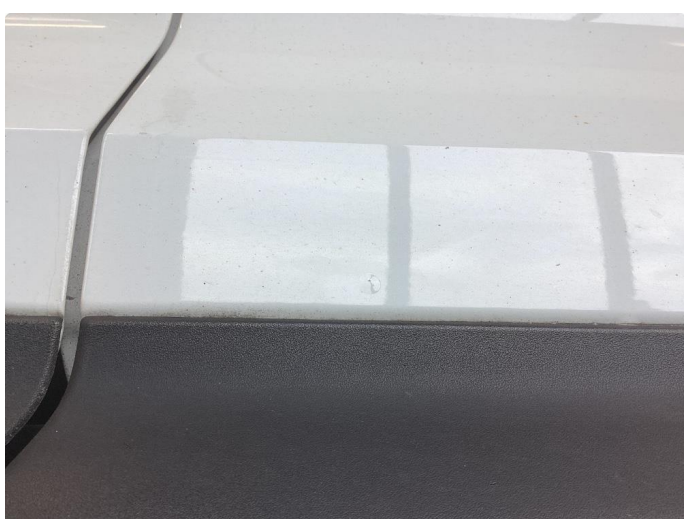
1.3 Noe sinkslipp alle dører