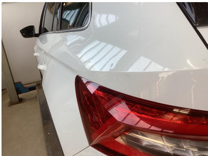
1.6 P-bulk venstre bakskjerm