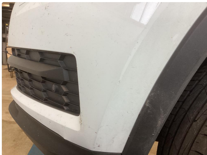
1.7 Noe riper stötfanger foran venstre side