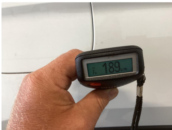
1.5 Höyre bakskjerm er omlakkert