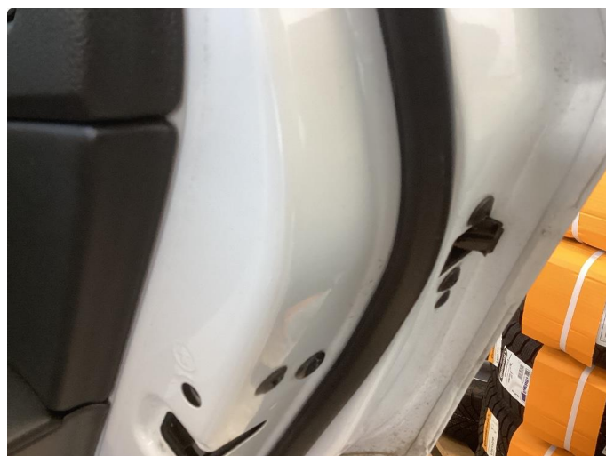
1.2 Karm beskytter er knekt på 3 dører