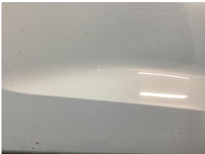
1.3 Noe sinkslipp alle dörer