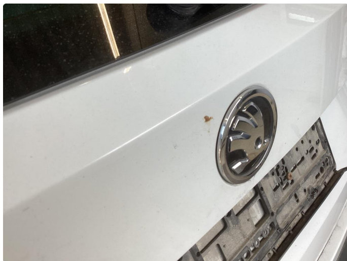
1.4 Rust og p-bulker bakluke