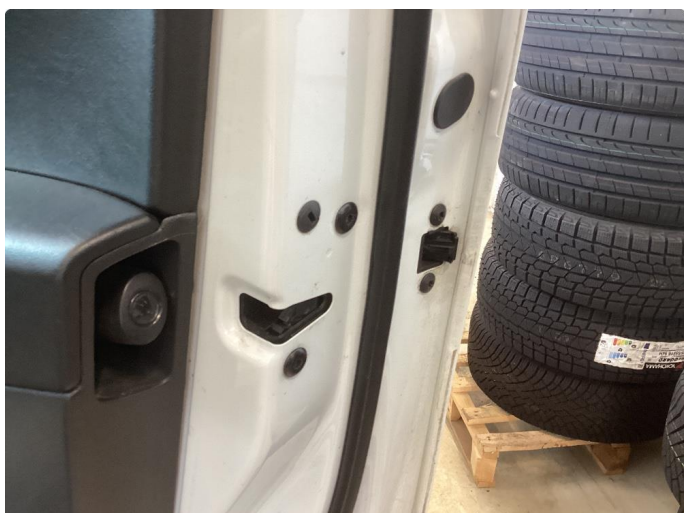
1.2 Karm beskytter er knekt på 3 dører