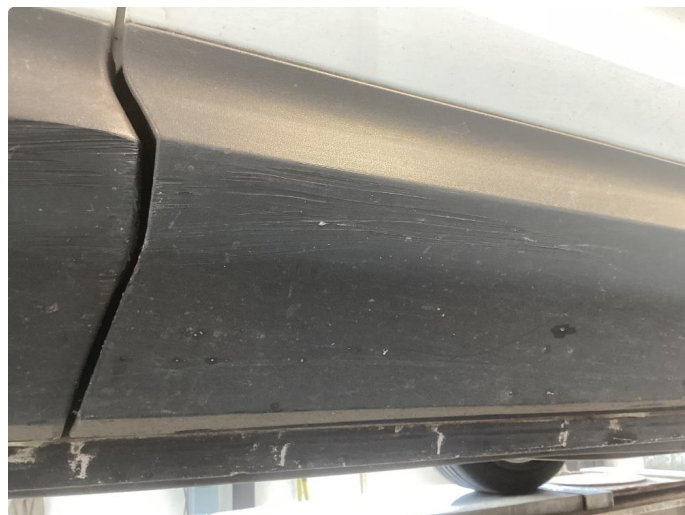
1.8 Riper deksler höyre for/bakdör