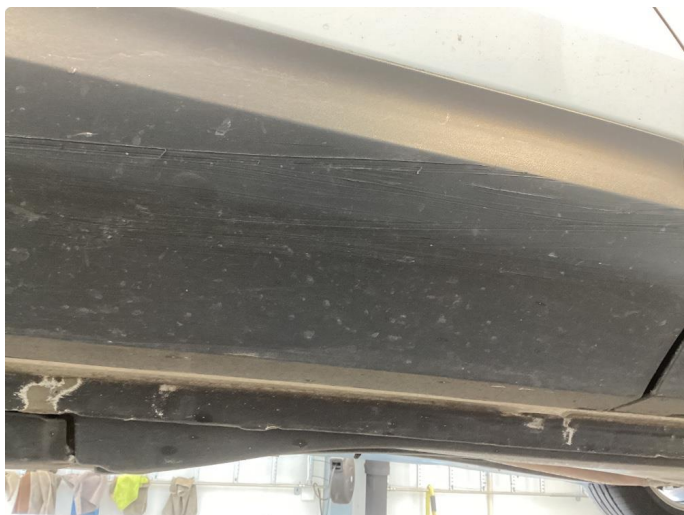
1.8 Riper deksler höyre for/bakdör