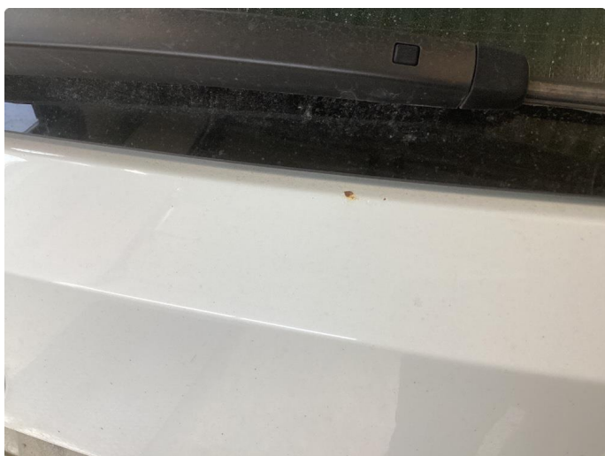
1.4 Rust og p-bulker bakluke