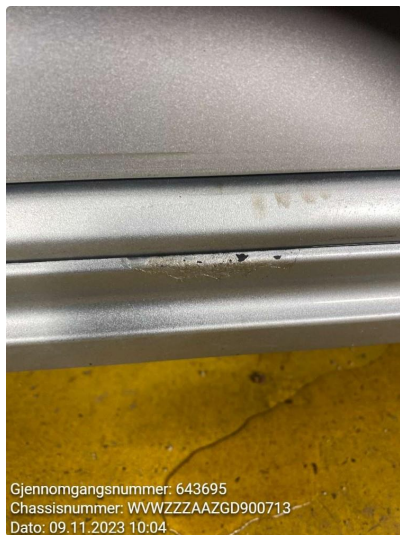
1.5 Riper skjørt høyre side