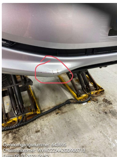
1.3 Riper nede begge sider framme