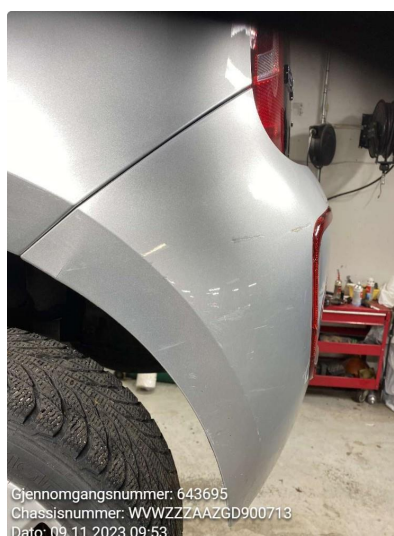
1.4 Skade venstre hjørne bak. skade og riper. refleks knekt