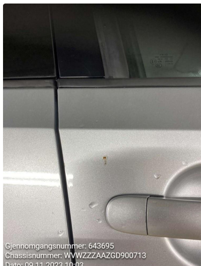
1.1 Sår i lakken høyre fordør