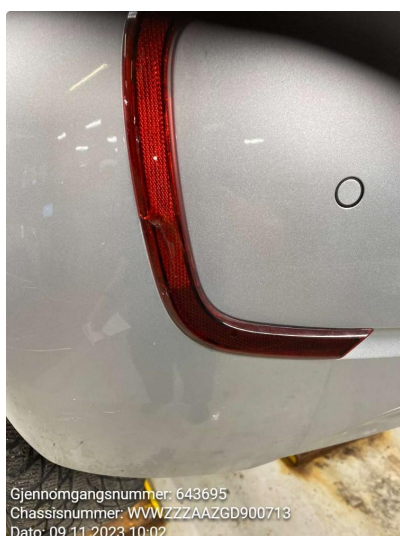
1.4 Skade venstre hjørne bak. skade og riper. refleks knekt