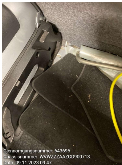
2.1 Mellomgulv baki mangler