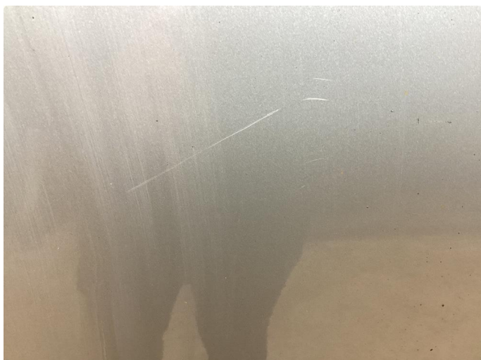
1.1 Bilen har en del riper i lakk