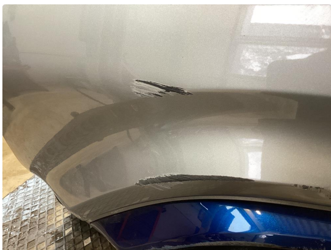
1.2 Skade stötfanger bak + list i underkant.