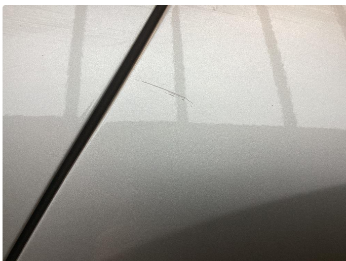
1.1 Bilen har en del riper i lakk