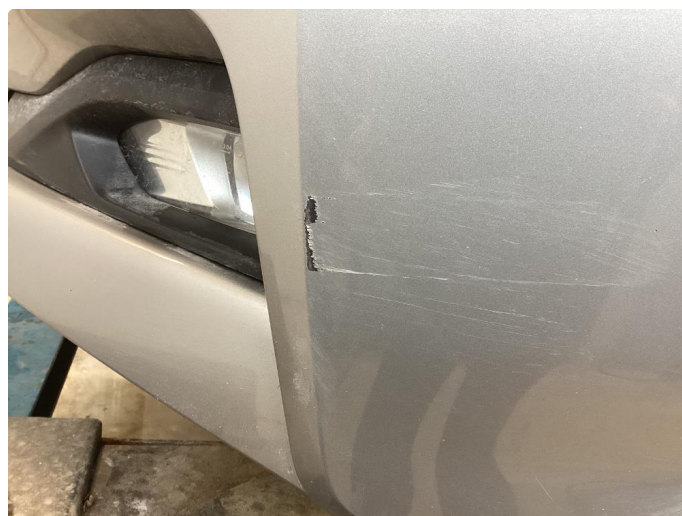
1.3 Skade stötfanger foran venstre side