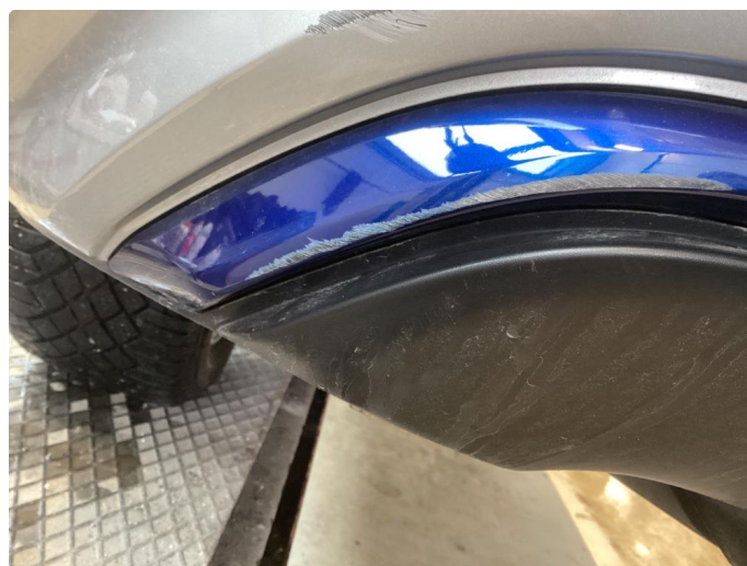
1.2 Skade stötfanger bak + list i underkant.