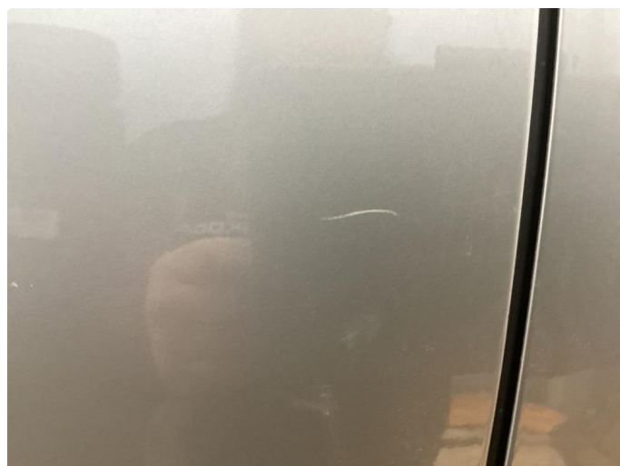
1.1 Bilen har en del riper i lakk