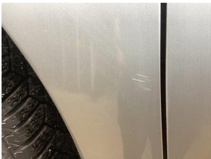
1.1 Bilen har en del riper i lakk