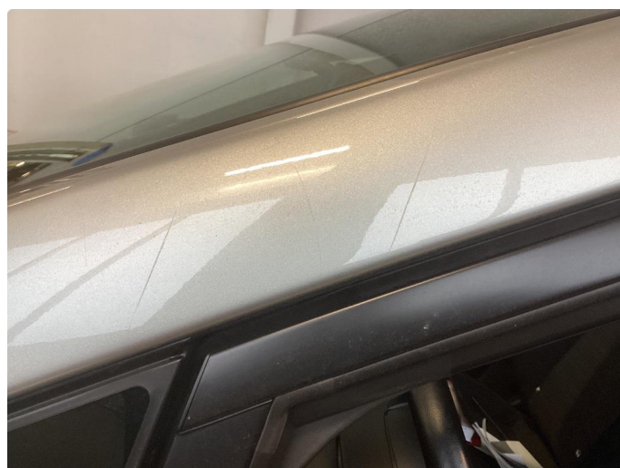
1.1 Bilen har en del riper i lakk