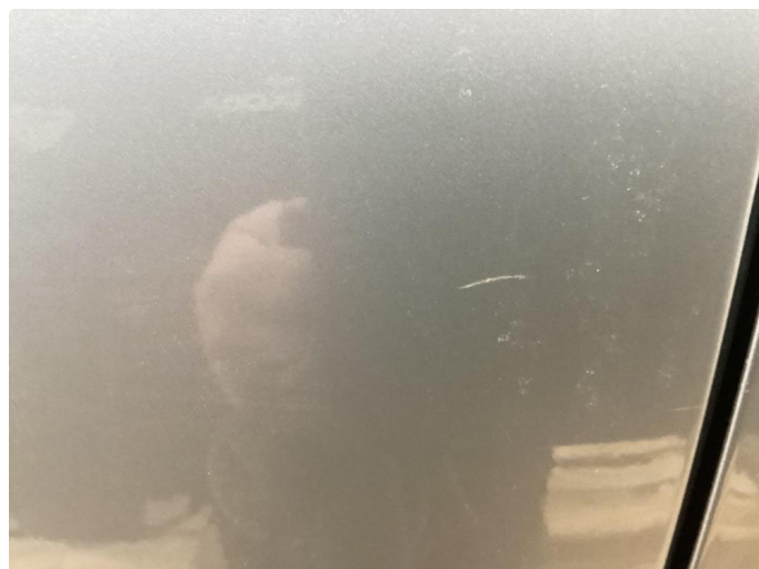
1.1 Bilen har en del riper i lakk