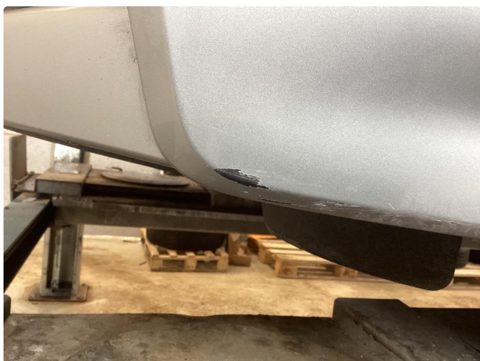
1.3 Skade stötfanger foran venstre side