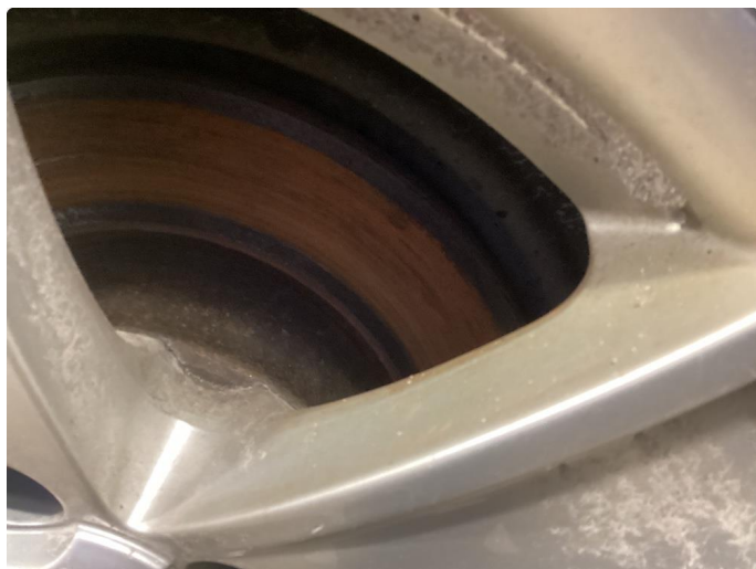
2.1 Påbegynt rust bremsar