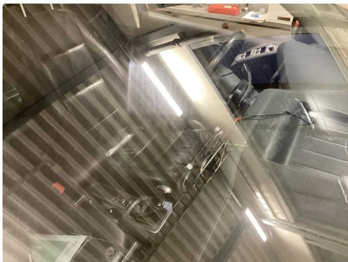
1.4 Noe slitt frontrute