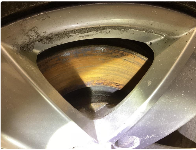
2.1 Påbegynt rust bremsar