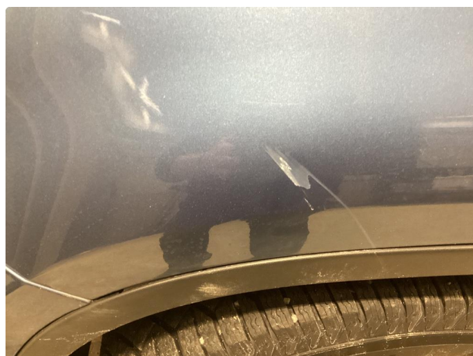
1.1 Div riper og knast i karosseri