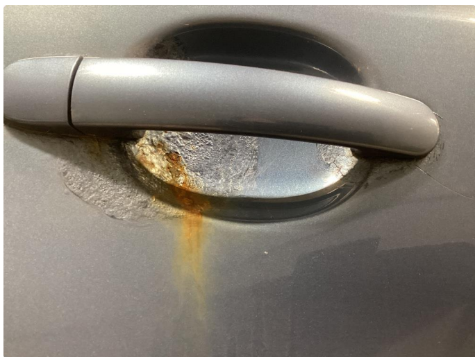
1.2 Mye rust rundt dørhandtak, spesielt bakdører