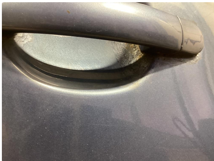
1.2 Mye rust rundt dørhandtak, spesielt bakdører