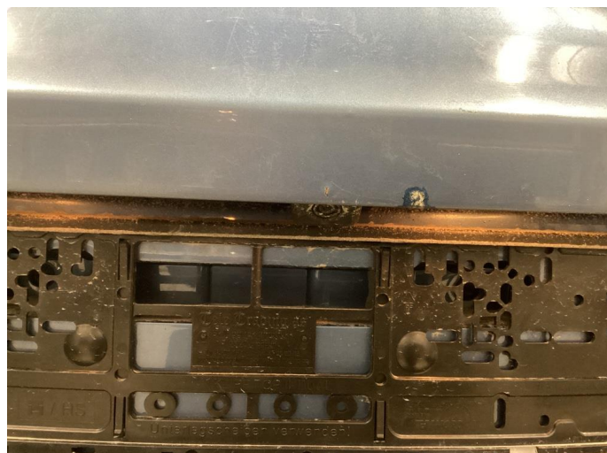
1.1 Div riper og knast i karosseri