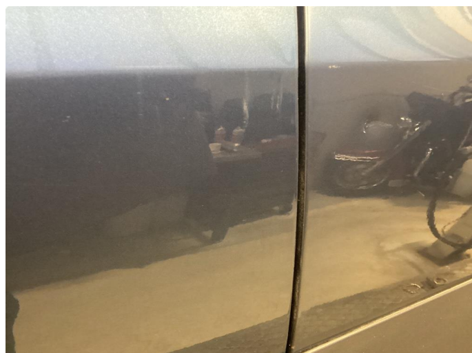
1.1 Div riper og knast i karosseri