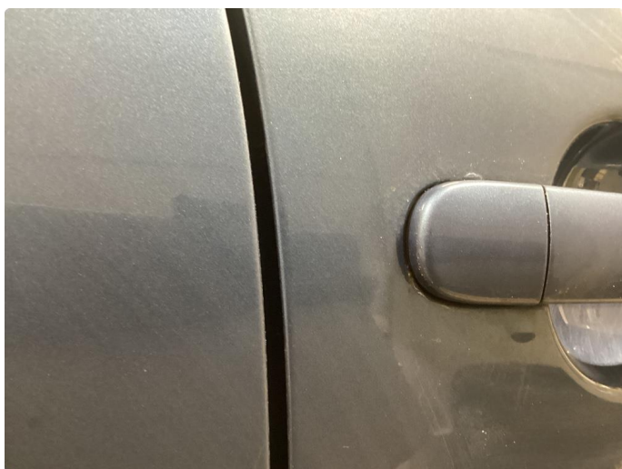
1.2 Mye rust rundt dørhandtak, spesielt bakdører