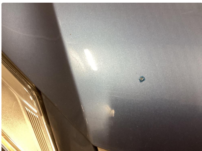
1.1 Div riper og knast i karosseri