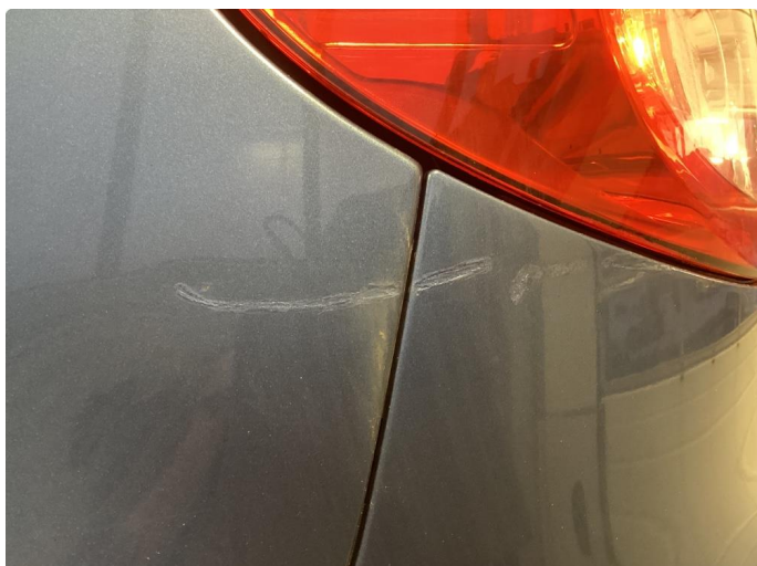
1.1 Div riper og knast i karosseri