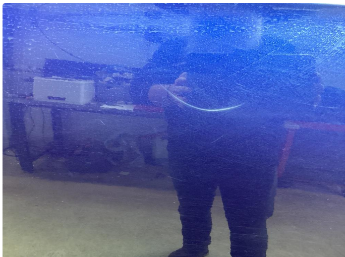
1.1 Bilen har en del overflate riper i karosseri