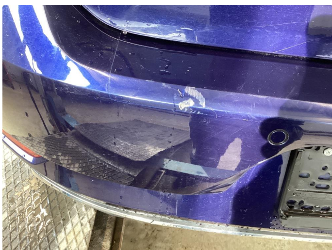
1.3 Hakk og riper støtfanger bak