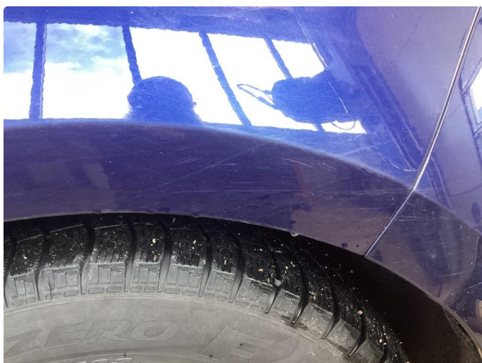
1.1 Bilen har en del overflate riper i karosseri