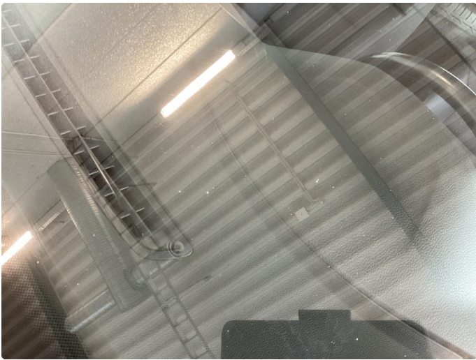
1.5 Frontrute har en del steinsprut