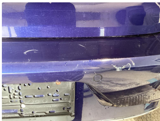
1.3 Hakk og riper støtfanger bak