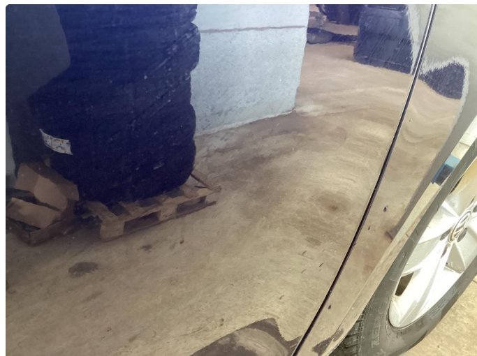
1.1 Bilen har en del overflate riper i karosseri