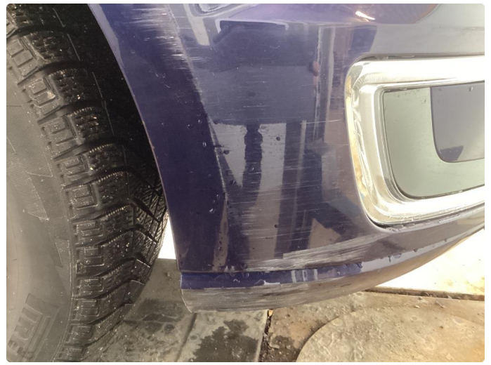
1.4 Skade stötfanger foran höyre side