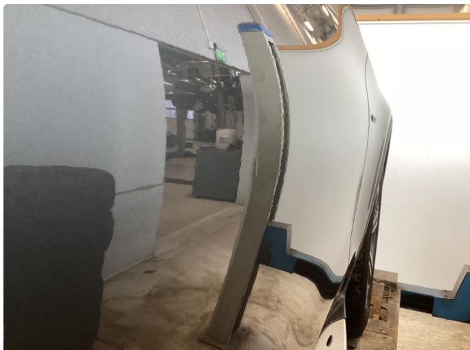
1.1 Liten p-bulk högre fordör