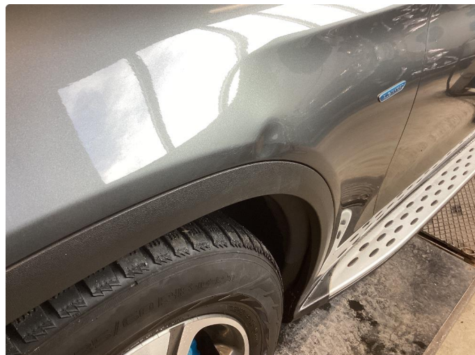
1.2 Bulk venstre forskjerm