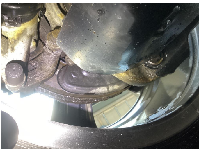
2.1 Påbegynt slitasje bremses bak