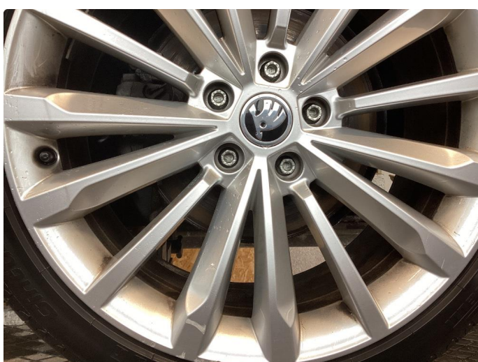
1.4 3 felger noe kantkjørt