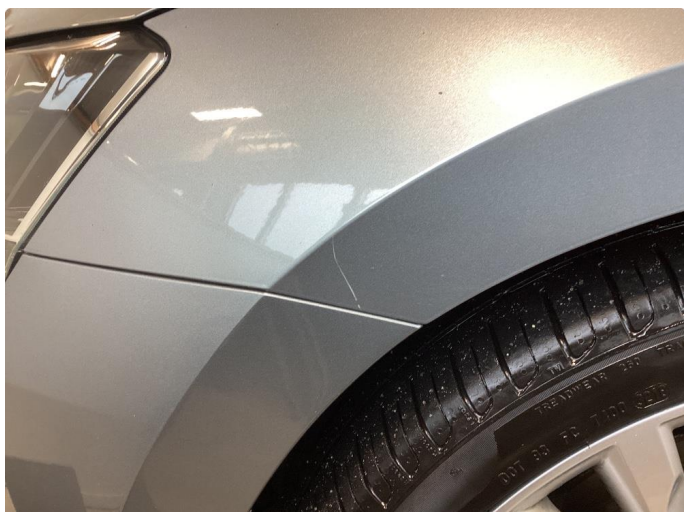
1.1 En del riper i lakk