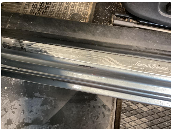
1.5 Slitt gjennom lakk Innsteg førerside