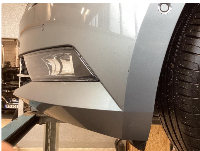
1.6 Riper hjørner foran