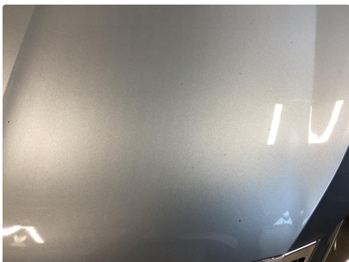
1.3 Steinsprut panser/front