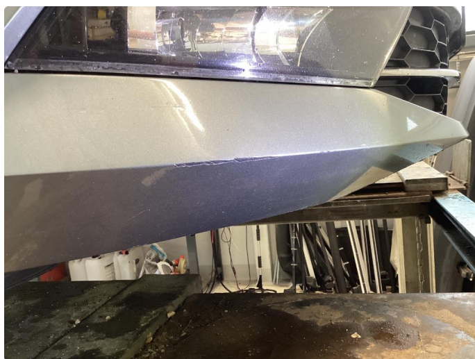
1.6 Riper hjørner foran