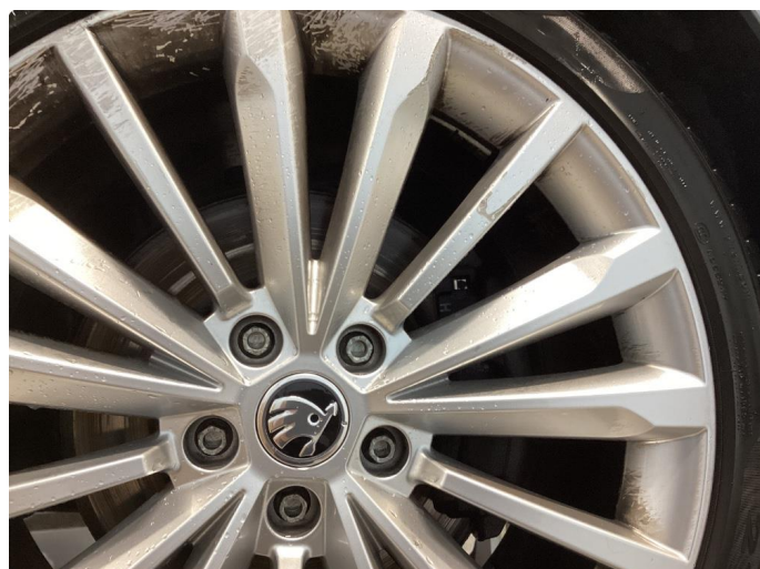
1.4 3 felger noe kantkjørt