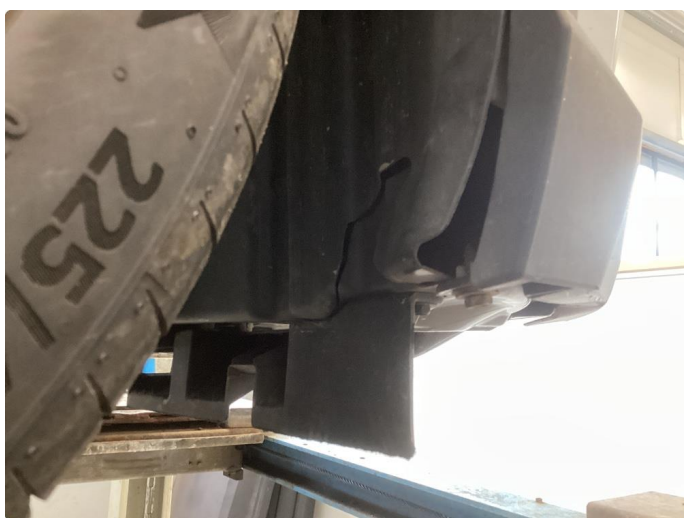
1.2 Höyre hjørne støtfanger foranog innerskjerm/deksler er knekt, feste innerskjerm venstre side