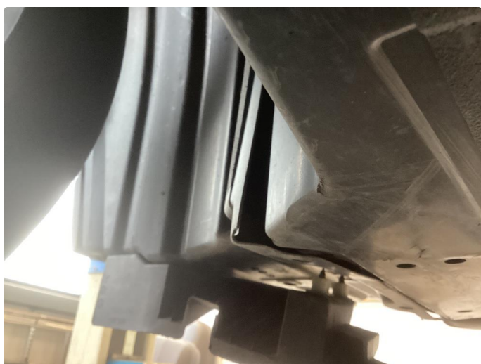
1.2 Höyre hjørne støtfanger foranog innerskjerm/deksler er knekt, feste innerskjerm venstre side