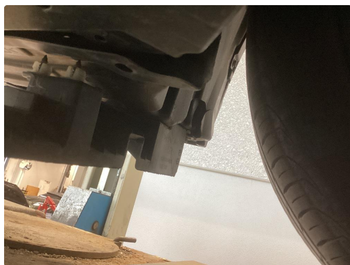
1.2 Höyre hjørne støtfanger foranog innerskjerm/deksler er knekt, feste innerskjerm venstre side