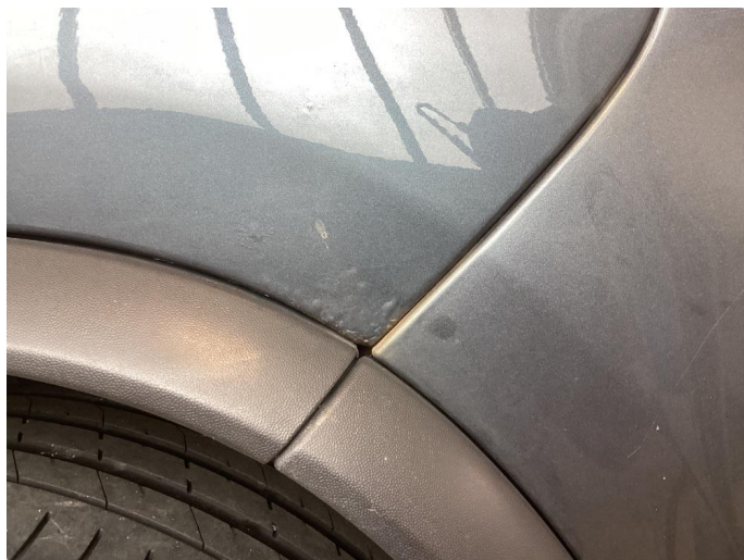
1.5 Rust begge bakskjermer