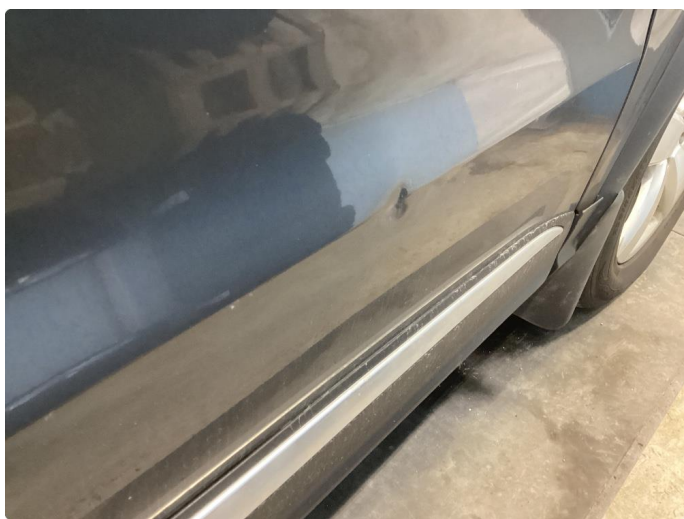
1.3 Bulk i knekk høyre fordør + 2-3 p-bulker