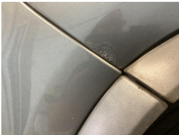
1.5 Rust begge bakskjermer