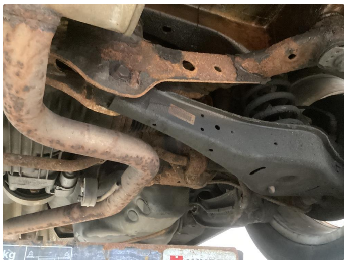
1.2 Bilen har mye rust i bakstilling