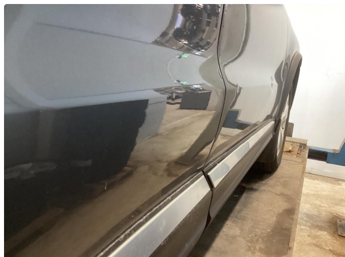
1.1 Div bruks merker i karosseri