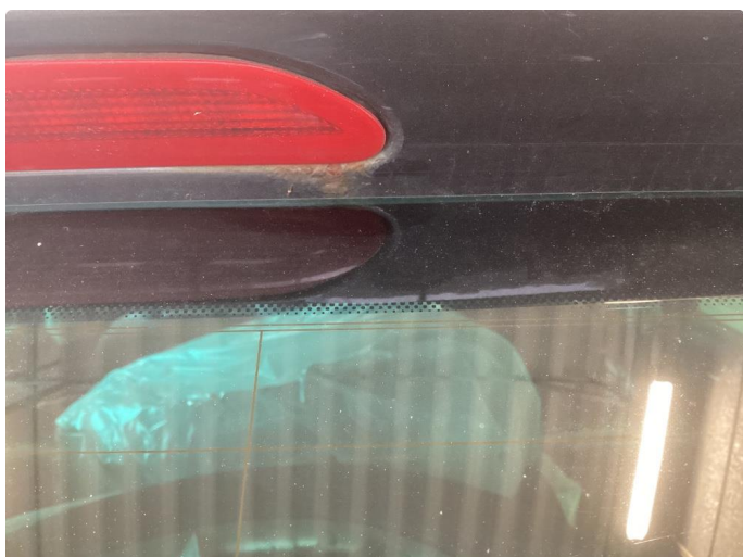
1.1 Div bruks merker i karosseri