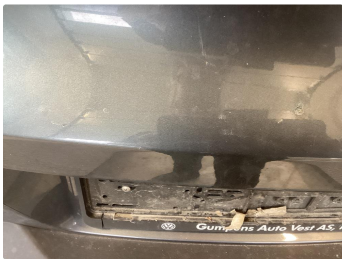
1.4 Bakluke har en del sinkslipp