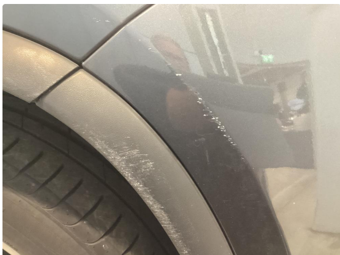
1.1 Div bruks merker i karosseri