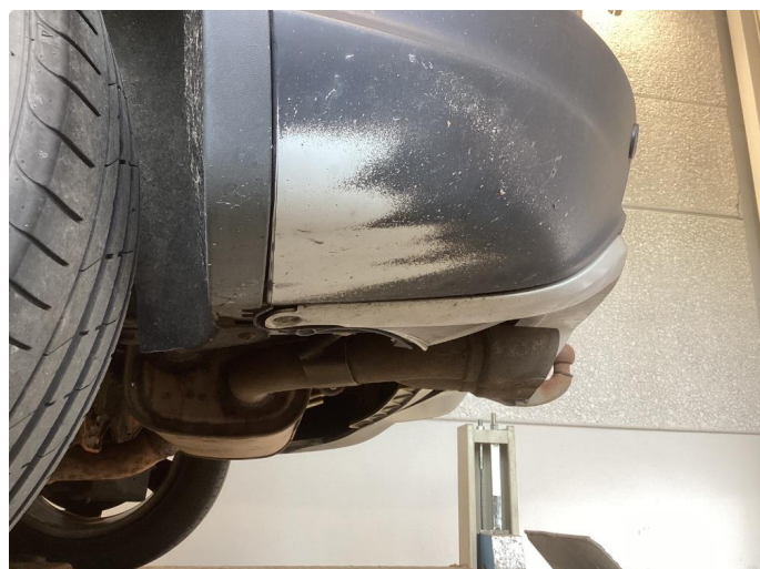
1.1 Div bruks merker i karosseri