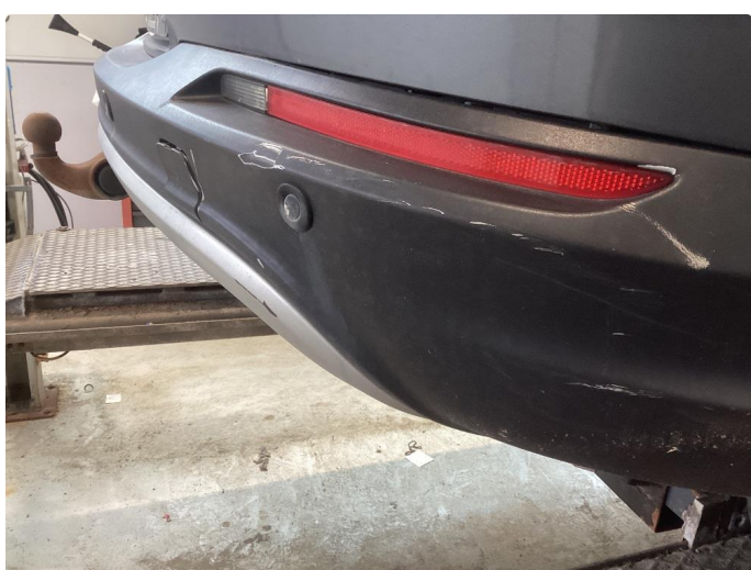
1.1 Div bruks merker i karosseri