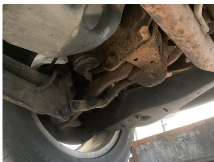
1.2 Bilen har mye rust i bakstilling