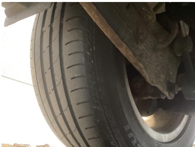
1.6 Sommerdekk sliter noe mere inside