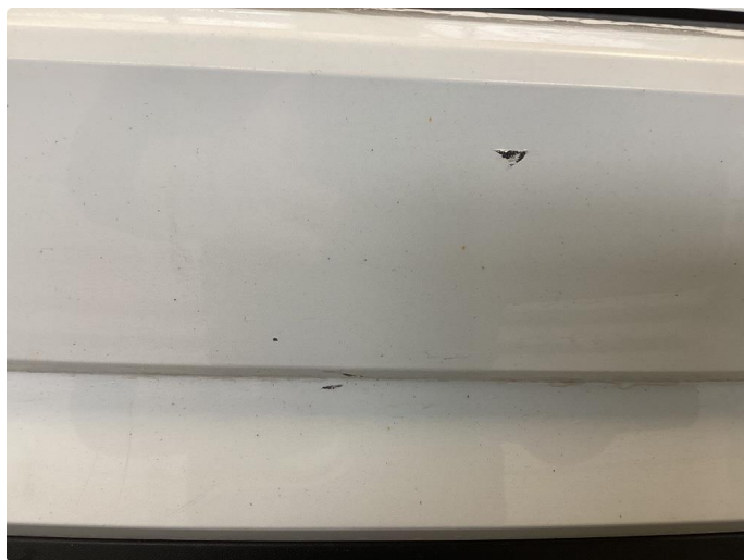
1.3 Div hakk i stötfanger bak