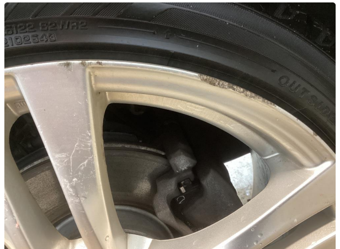
1.2 Oxyderte, ripete og kantkjørte vinterfelger