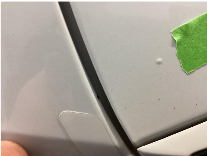
1.1 Påbegynt rust og sinkslipp begge bakskjermer også sinkslipp høyre for/bakdør