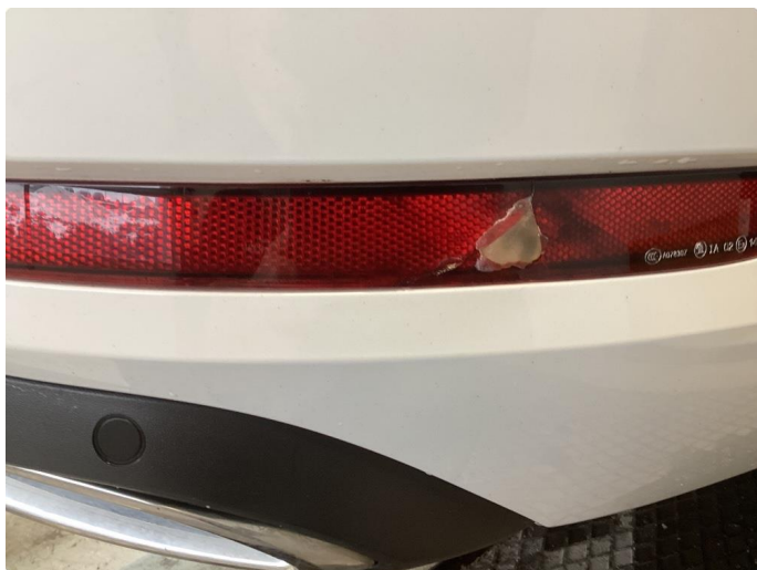
1.4 Knekt refleks stötfanger bak høyre side