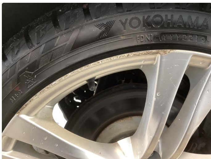
1.2 Oxyderte, ripete og kantkjörte vinterfelger