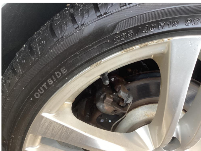
1.2 Oxyderte, ripete og kantkjörte vinterfelger