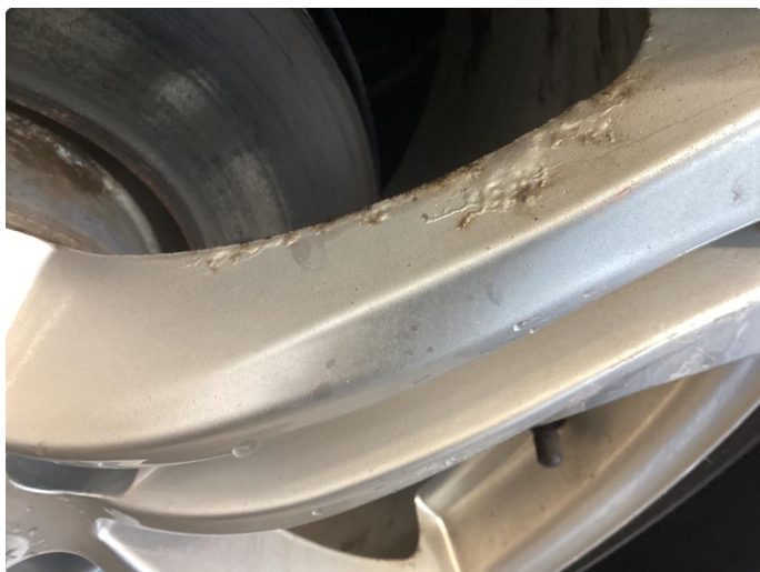
1.2 Oxyderte, ripete og kantkjörte vinterfelger