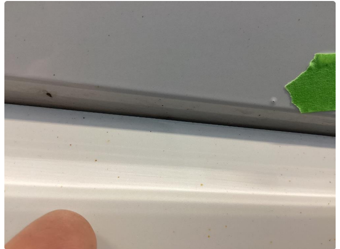
1.1 Påbegynt rust og sinkslipp begge bakskjermer også sinkslipp høyre for/bakdør