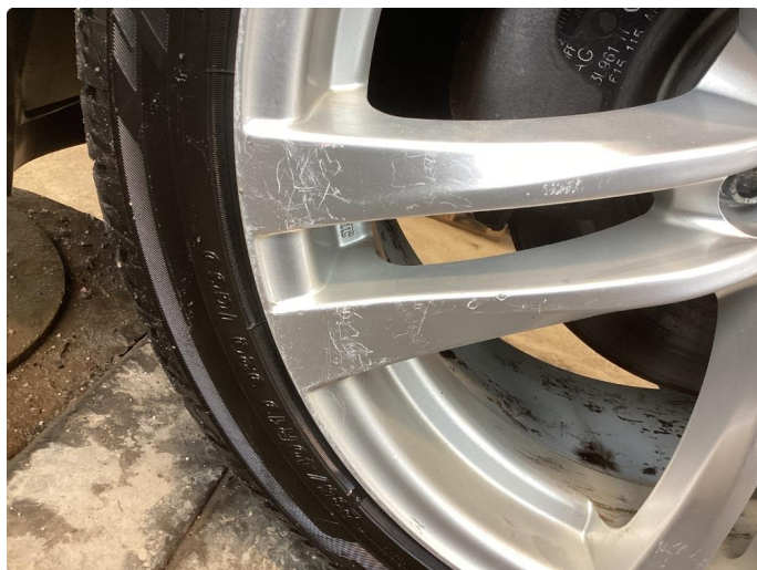
1.2 Oxyderte, ripete og kantkjörte vinterfelger