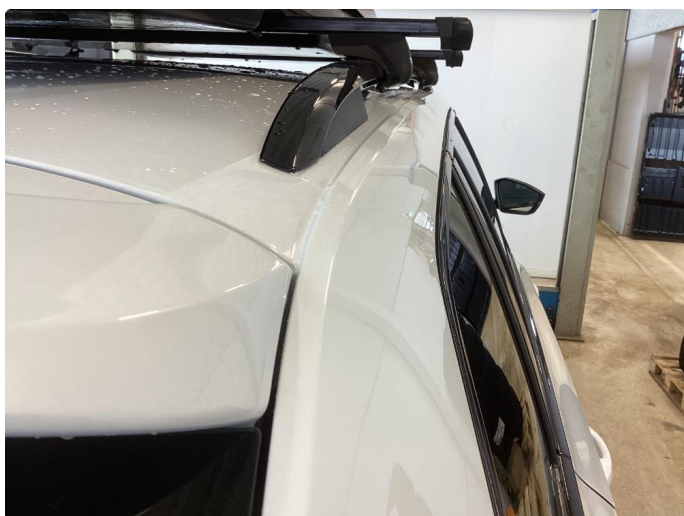
1.6 Flere små bulker høyre takvange, noen svake venstre takvange