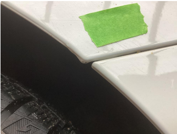
1.1 Påbegynt rust og sinkslipp begge bakskjermer også sinkslipp høyre for/bakdør