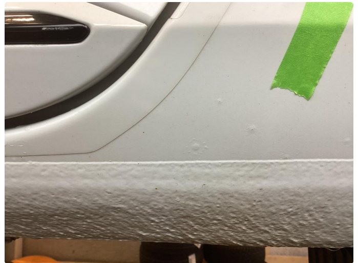
1.1 Påbegynt rust og sinkslipp begge bakskjermer også sinkslipp høyre for/bakdør