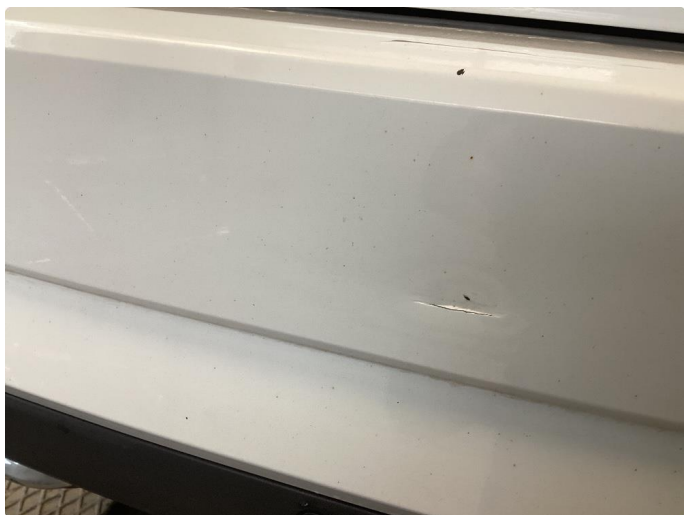
1.3 Div hakk i stötfanger bak