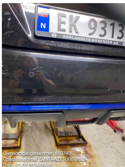
1.2 Mye riper bakfanger. skade høyre side