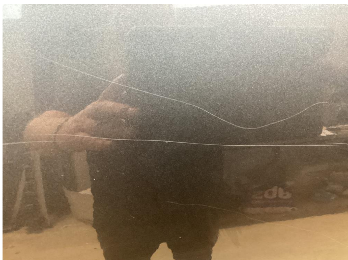
1.1 Riper gjennom lakk venstre fordør