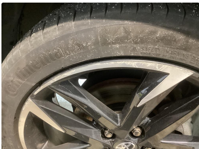
1.2 2 sommerfelger kantkjørte