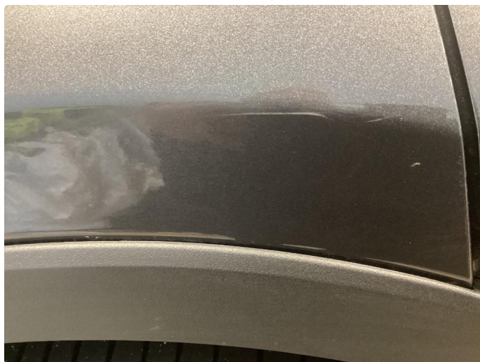
1.3 Riper stötfanger bak og höyre bakskjerm