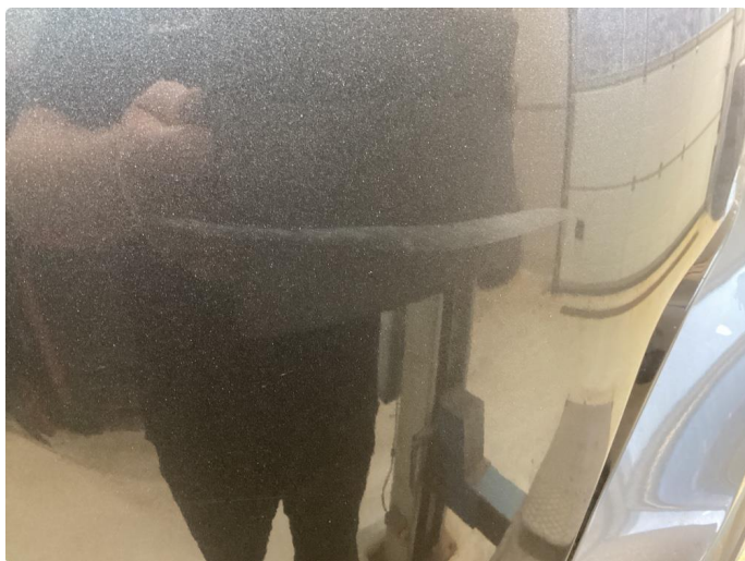
1.3 Riper stötfanger bak og höyre bakskjerm