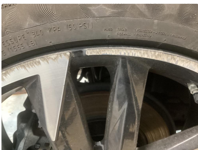
1.2 2 sommerfelger kantkjørte