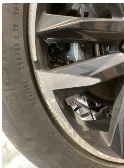
1.2 2 sommerfelger kantkjørte