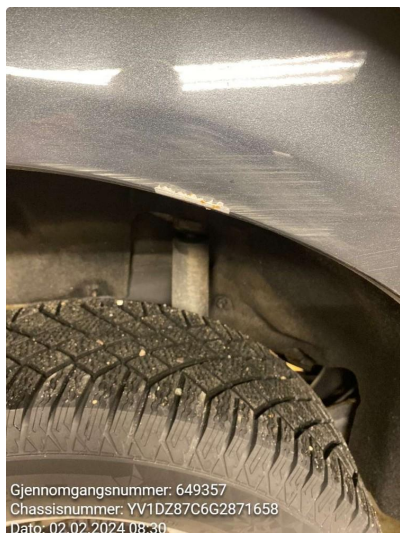
1.1 Ripe Høyre bakskjerm