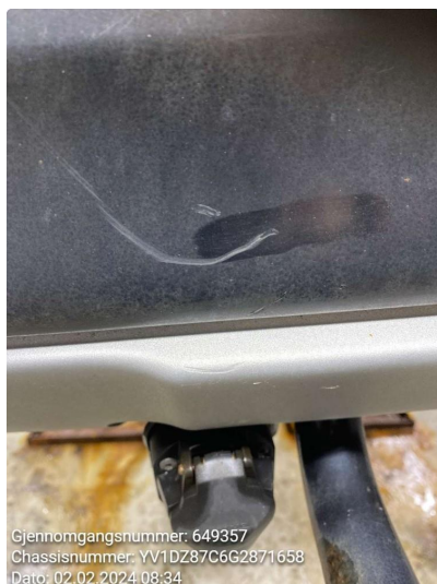
1.3 Noe riper rundt hengerfeste