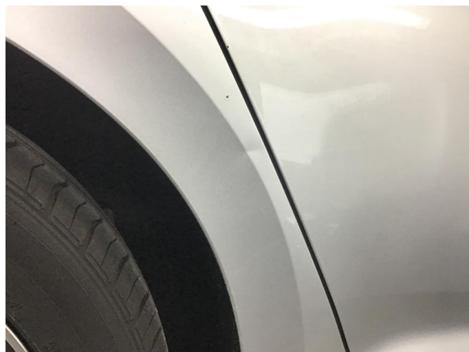
1.1 Rust høyre bakskjerm og p bulk