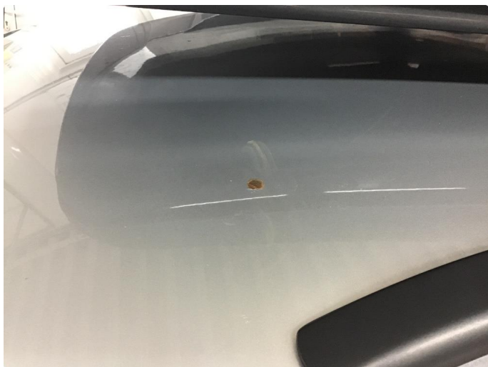
1.3 Rust-rose tak venstre side foran.