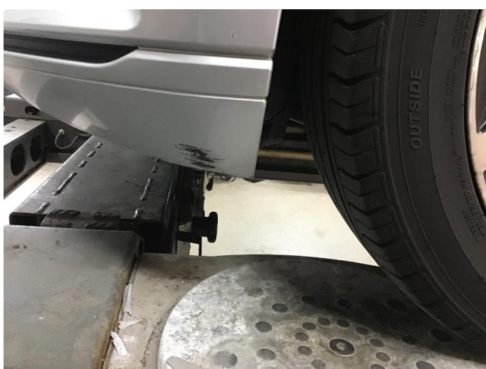
1.2 Normal bruksslitasje, noe steinsprang.