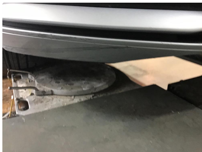
1.2 Normal bruksslitasje, noe steinsprang.