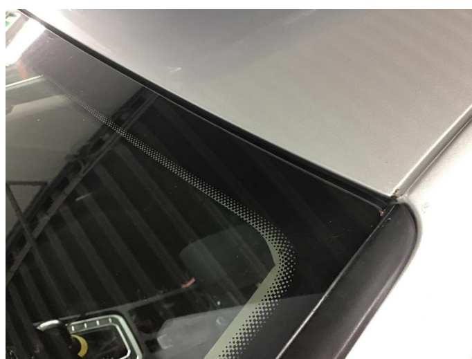
1.3 Rust-rose tak venstre side foran.