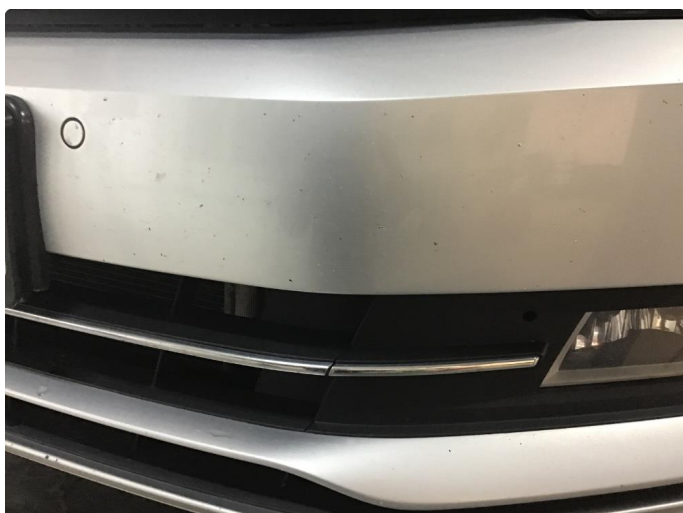
1.2 Normal bruksslitasje, noe steinsprang.