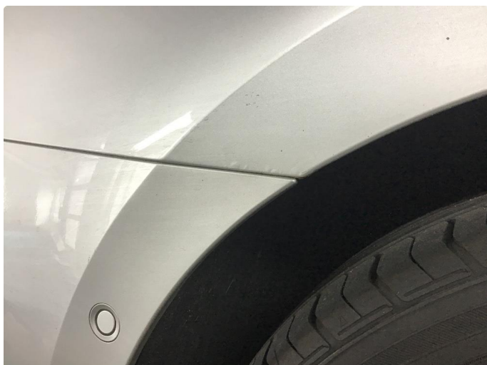
1.1 Rust høyre bakskjerm og p bulk