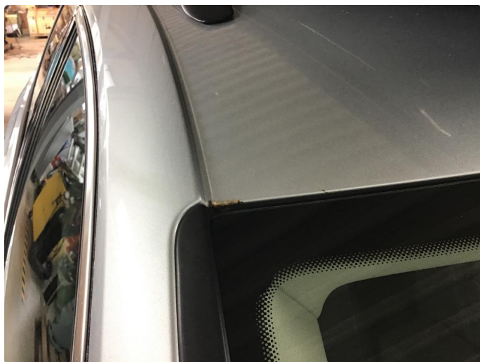
1.3 Rust-rose tak venstre side foran.