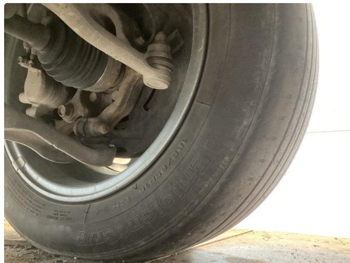
1.1 Nye sommerdekk