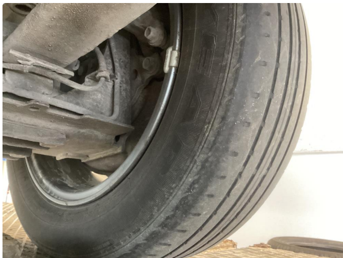
1.1 Nye sommerdekk