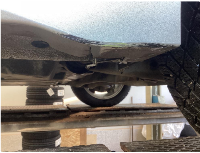
1.3 Skade venstre kanal