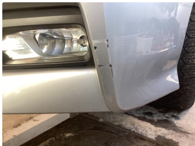
1.2 Riper/skade støtfanger foran venstre side og sprekt støtfanger høyre side