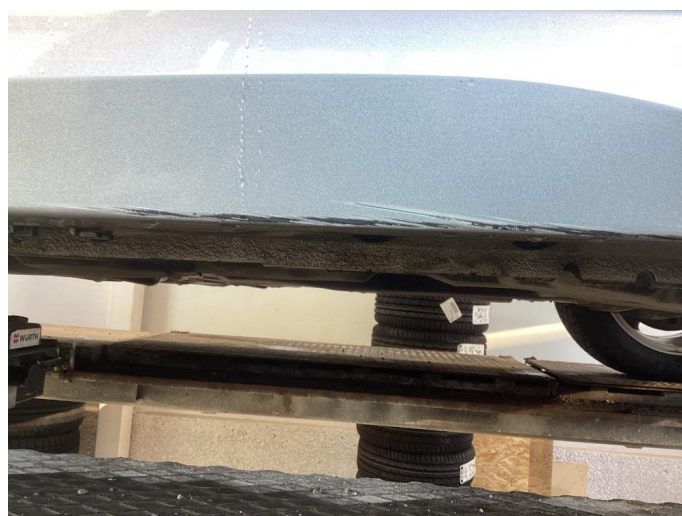
1.3 Skade venstre kanal