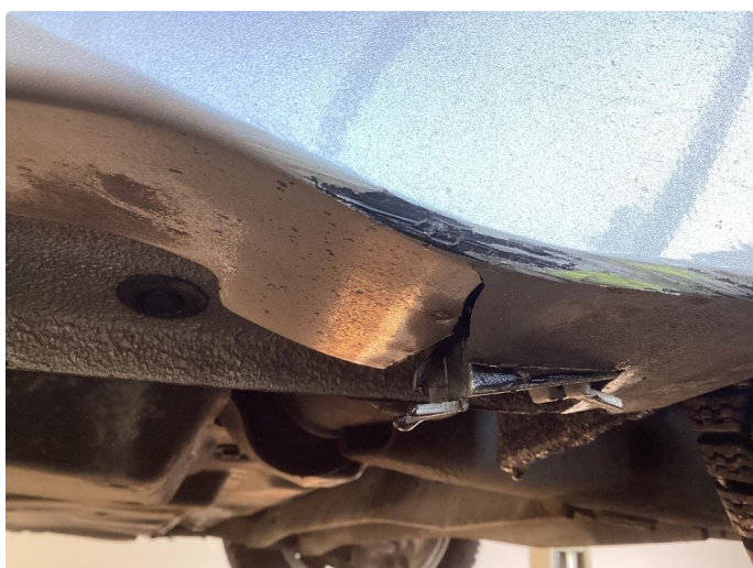
1.3 Skade venstre kanal