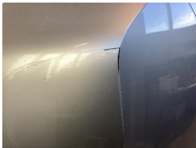
1.2 Riper/skade støtfanger foran venstre side og sprekt støtfanger høyre side