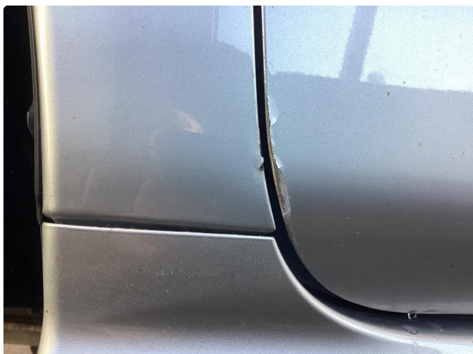
1.1 Lakk flasser venstre forskjerm og dør