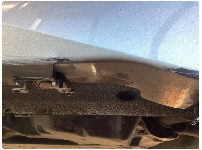
1.3 Skade venstre kanal