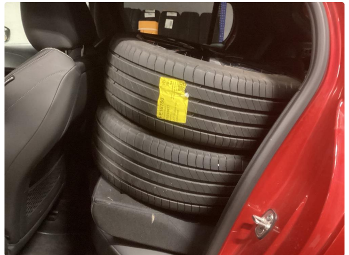
2.1 Normal Bruks slitasje