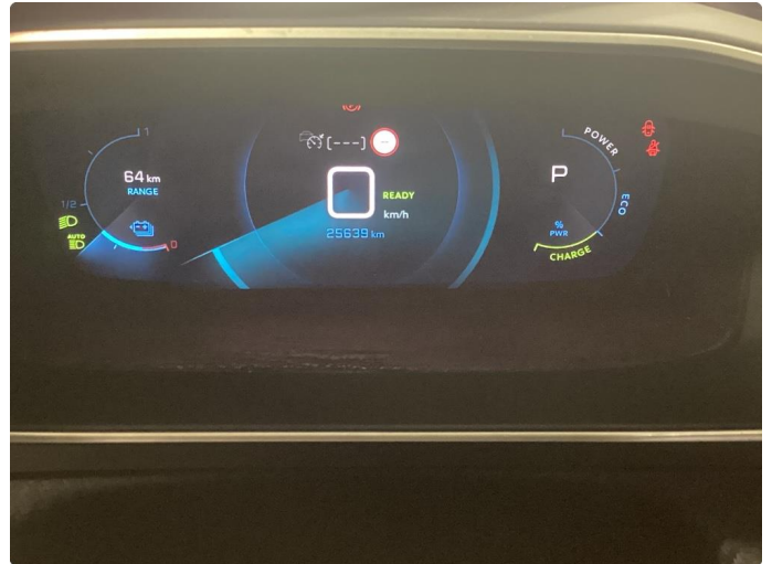
2.1 Normal Bruks slitasje