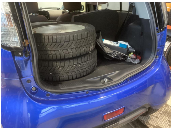
1.1 Normal Bruks slitasje