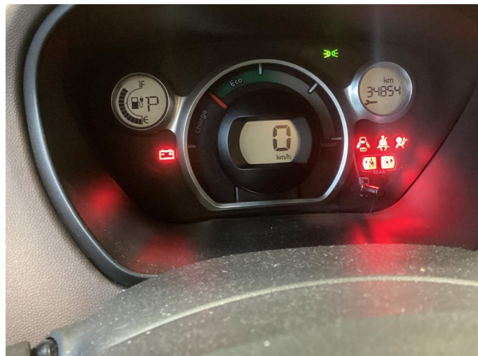
1.1 Normal Bruks slitasje