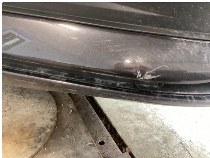
1.4 Bulk i stötfanger foran