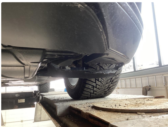
1.5 Feste spoiler underside stötfanger foran venstre side