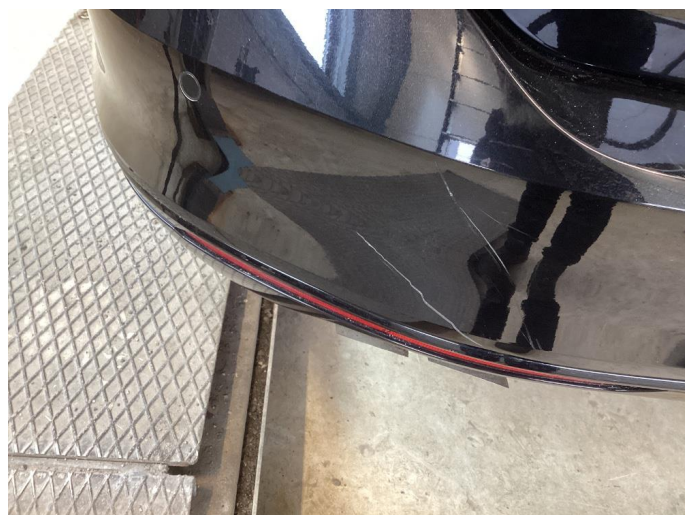
1.1 Bilen har en del overflate riper som må bearbeides.