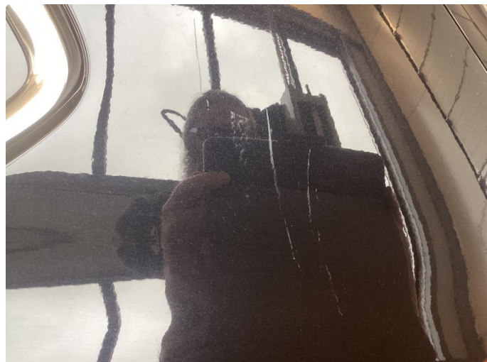
1.1 Bilen har en del overflate riper som må bearbeides.