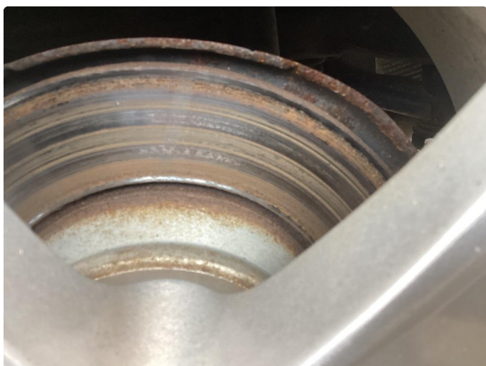
2.1 Påbegynt rust bremsar bak