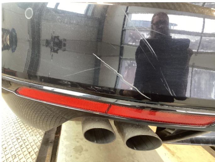
1.3 Riper i stötfanger bak