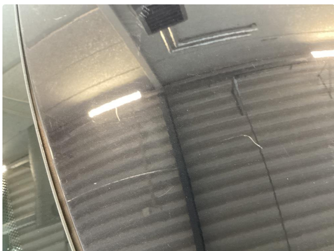
1.1 Bilen har en del overflate riper som må bearbeides.