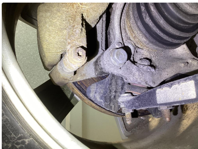
2.1 Påbegynt rust bremsar bak