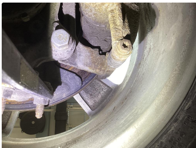
2.1 Påbegynt rust bremsar bak