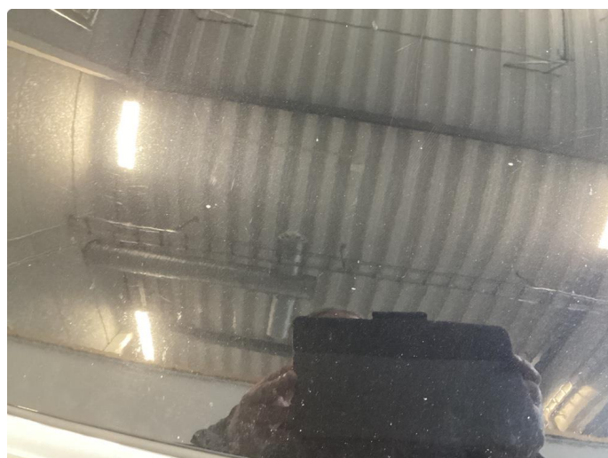
1.2 Panser har en del steinsprut