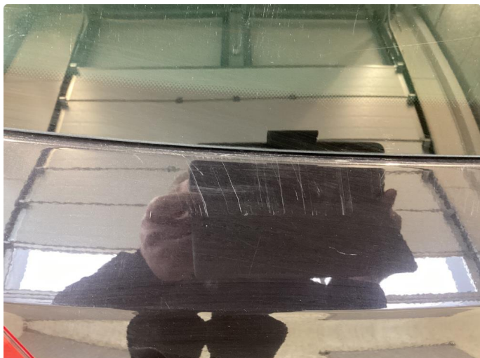
1.1 Bilen har en del overflate riper som må bearbeides.