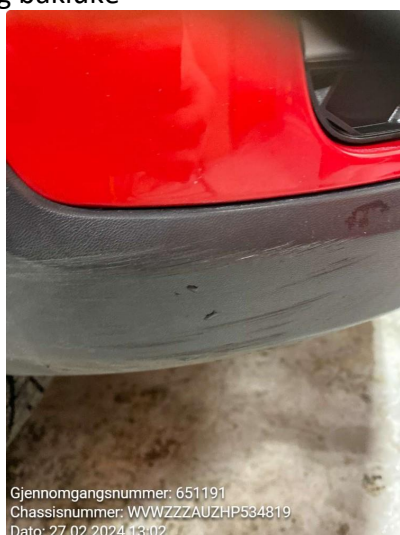
1.2 Noe riper nederst i plast høyre hjørne framme