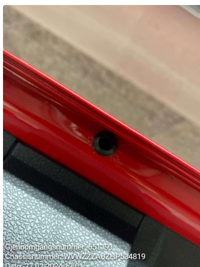
1.1 Noe riper nederst på bakluke og litt rust rundt drenering bakluke