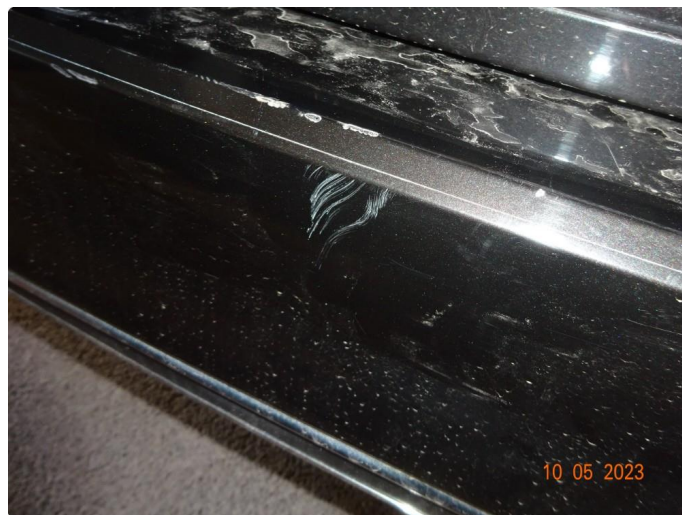
1.4 Riper hakk i fanger bak