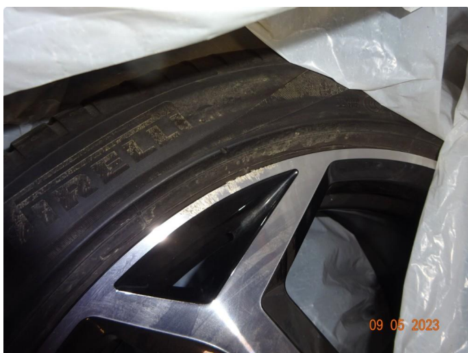
1.3 3 sommerfelger er kantkjørte