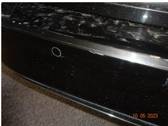
1.4 Riper hakk i fanger bak