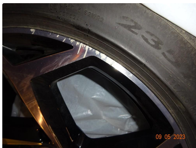
1.3 3 sommerfelger er kantkjørte