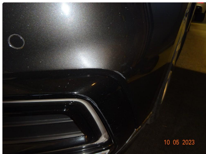
1.2 Ripe Hjørne ståtfanger v side foran og lykte ring