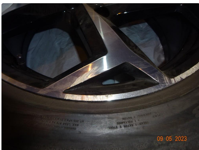
1.3 3 sommerfelger er kantkjørte