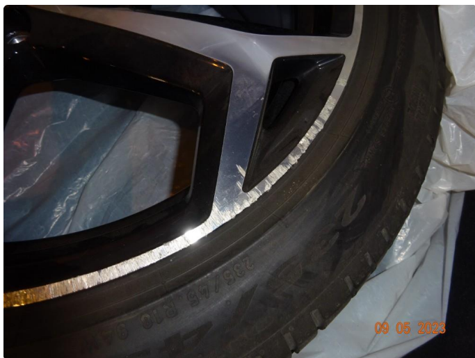
1.3 3 sommerfelger er kantkjørte