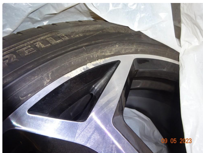
1.3 3 sommerfelger er kantkjørte