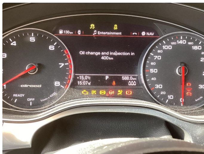
2.1 Trenger service