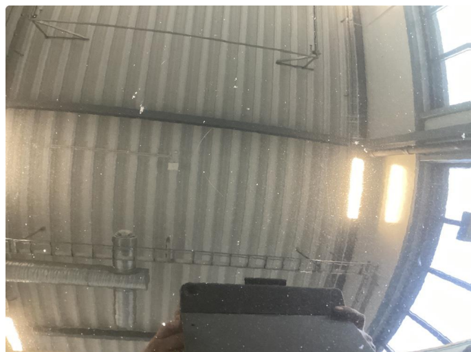
1.1 Mye stensprut