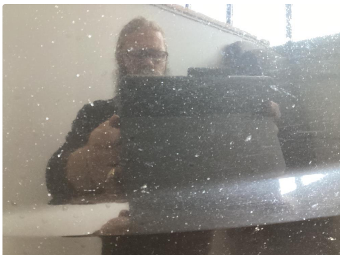
1.1 Mye stensprut