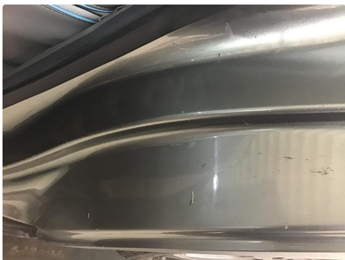
1.7 Riper/knast innsteg bakdører