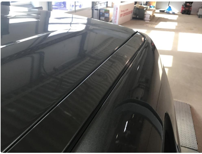
1.11 Flere småbulker tak/takvange venstre side