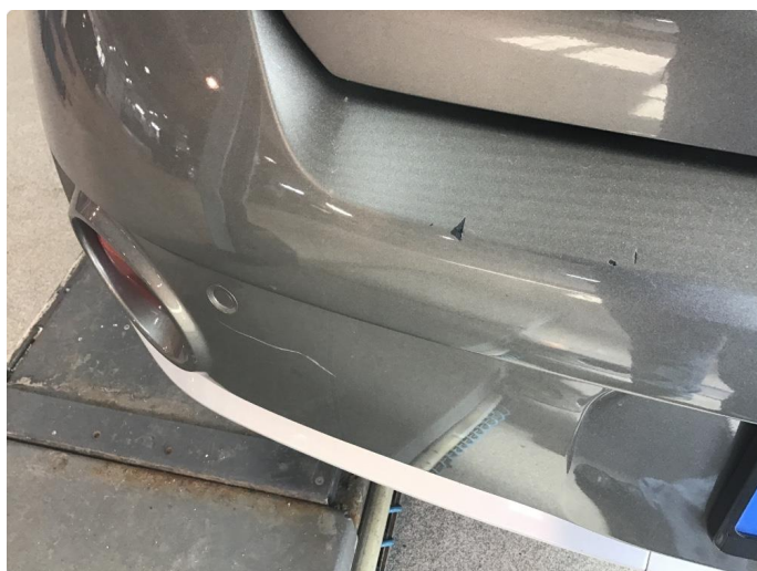
1.8 Riper/knast støtfanger bak