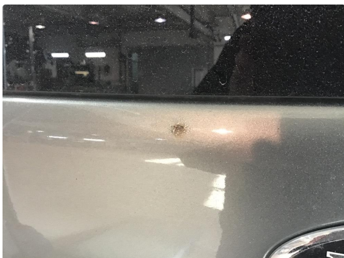
1.3 Rustrose bakluke