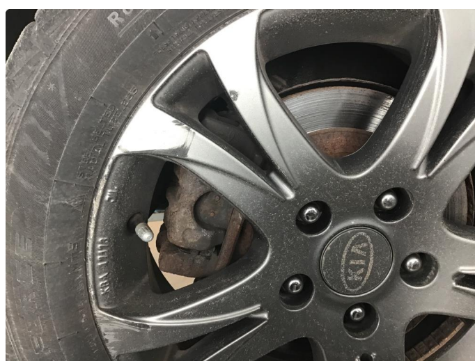
1.6 3 vinterfelger litt kantkjørte