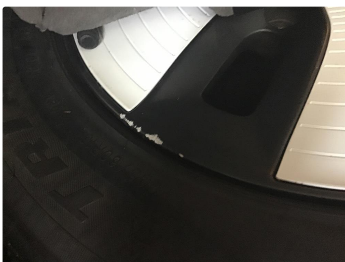
1.5 2 sommerfelger litt kantkjørte