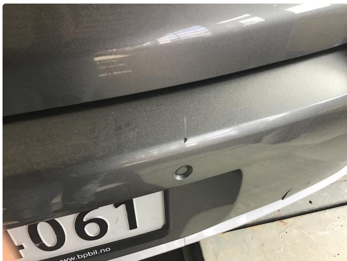
1.8 Riper/knast støtfanger bak