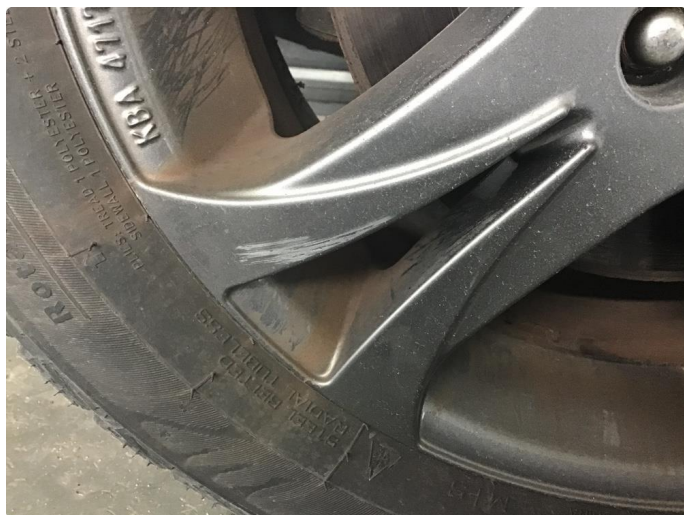
1.6 3 vinterfelger litt kantkjørte