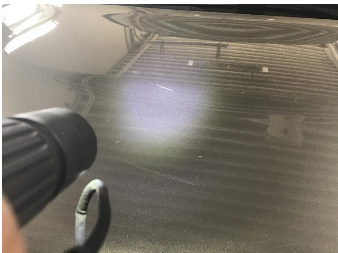
1.1 En del riper og noe steinsprut med rust