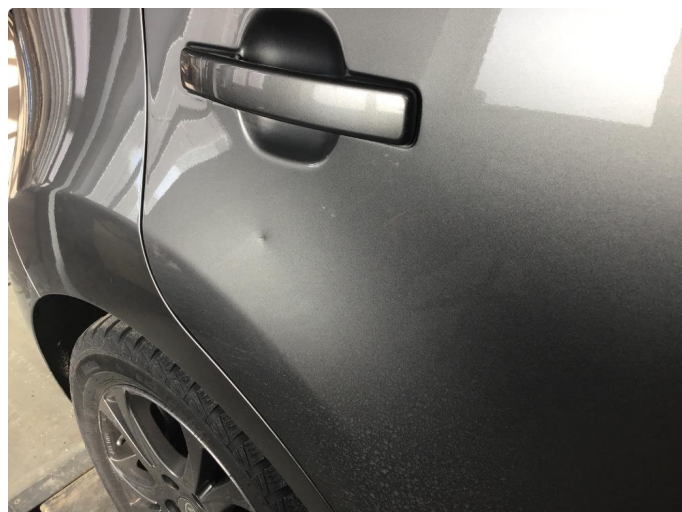
1.2 3 p bulker og knast venstre baddør