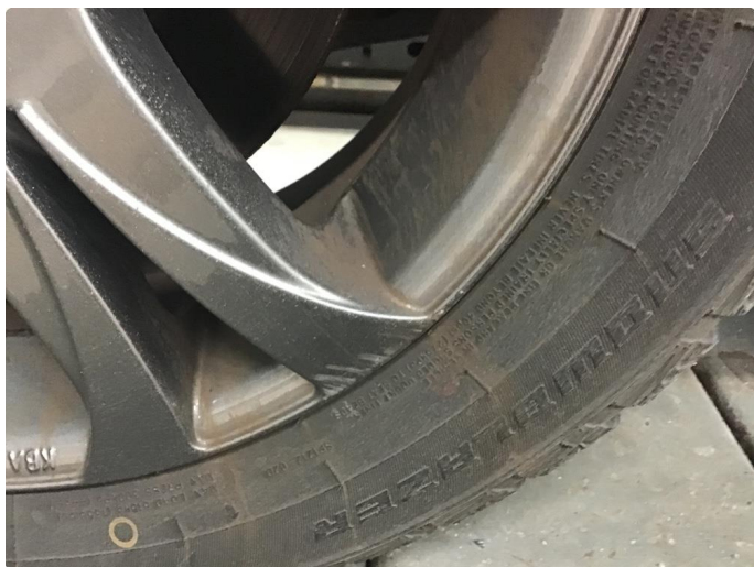
1.6 3 vinterfelger litt kantkjørte