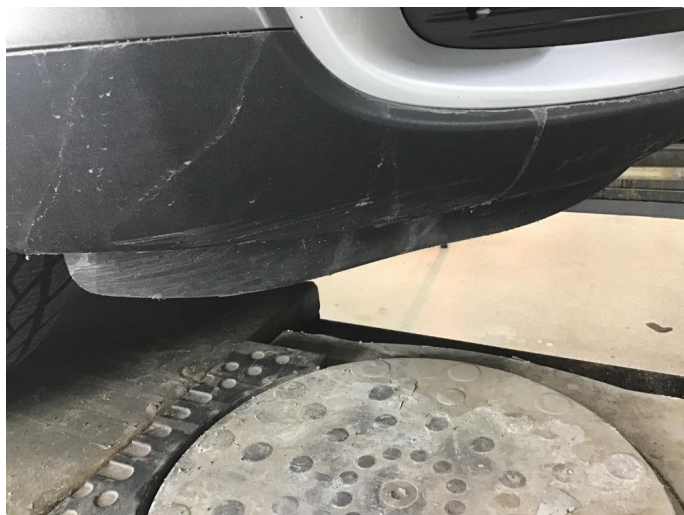
1.9 Riper i sort plast støtfanger foran nede høyre side