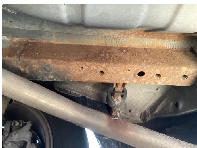
1.2 Bilen har en del rust under bak