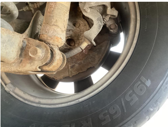
2.2 Mangler bremseskjold bak venstre side og rustet opp høyre side