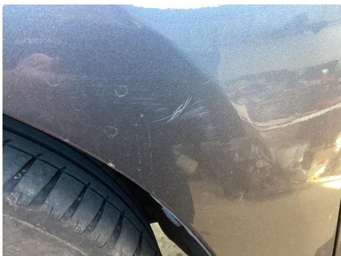
1.1 Div riper og bruks merker i karosseri