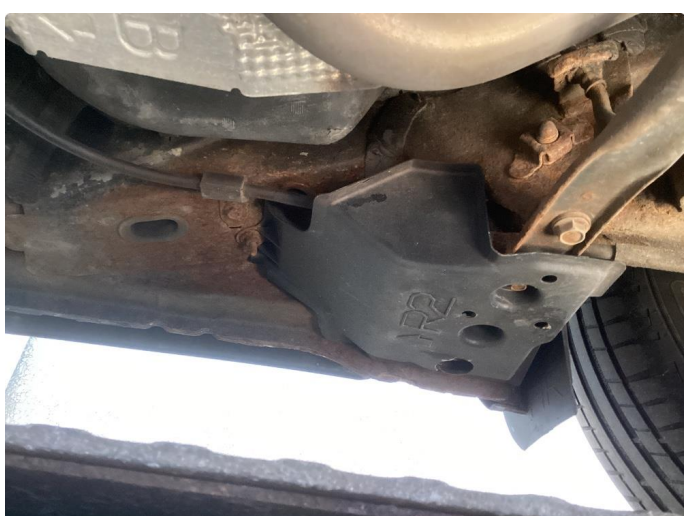
1.2 Bilen har en del rust under bak