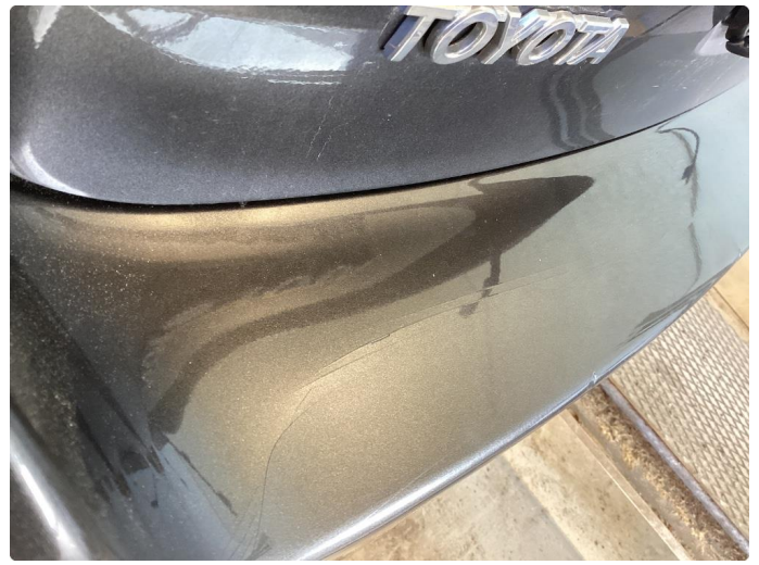
1.4 Skade stötfanger bak