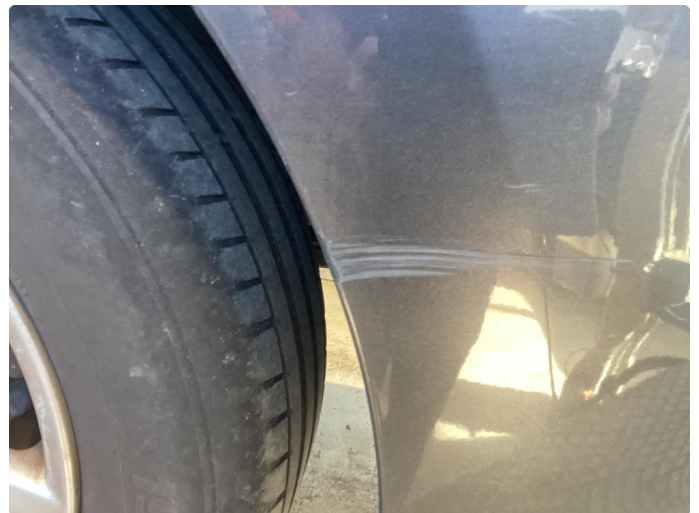
1.4 Skade stötfanger bak