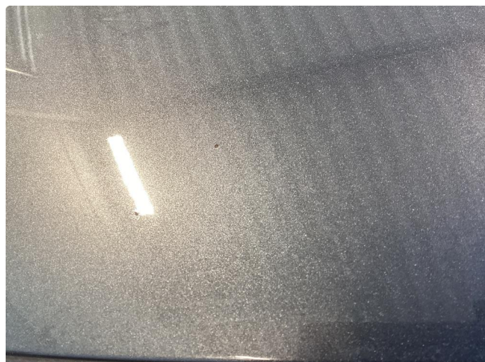
1.1 Div riper og bruks merker i karosseri