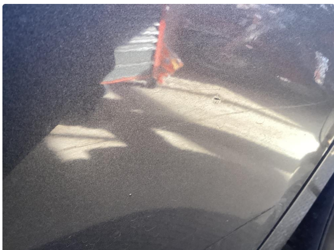
1.1 Div riper og bruks merker i karosseri