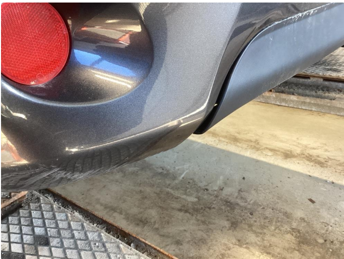
1.4 Skade stötfanger bak