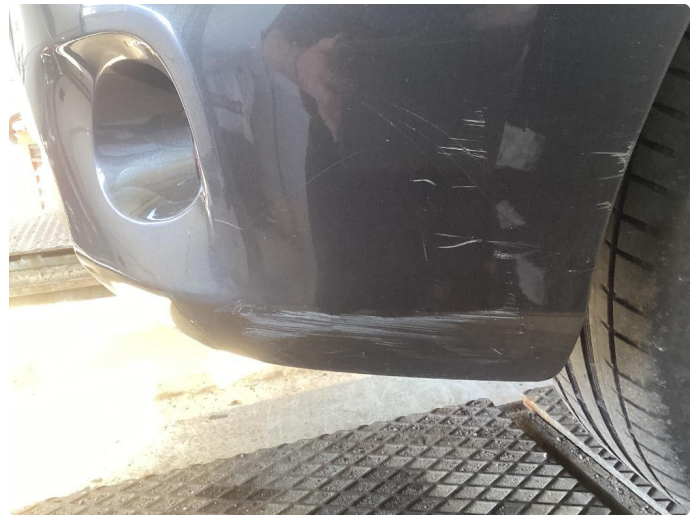
1.4 Skade stötfanger bak