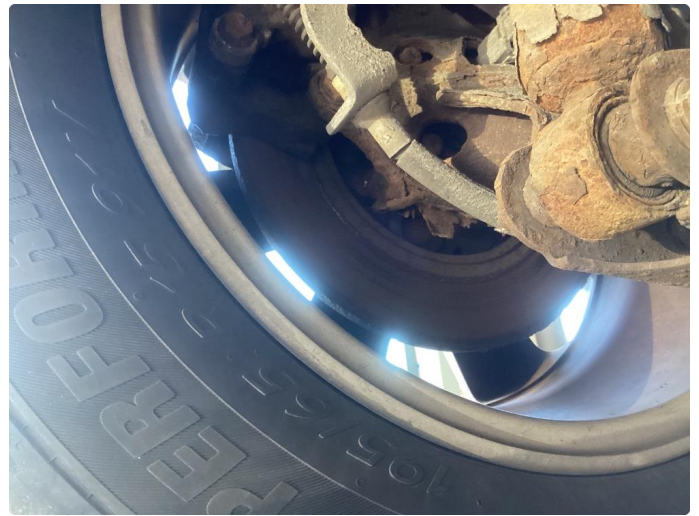
2.2 Mangler bremseskjold bak venstre side og rustet opp høyre side