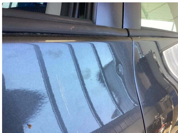
1.1 Div riper og bruks merker i karosseri