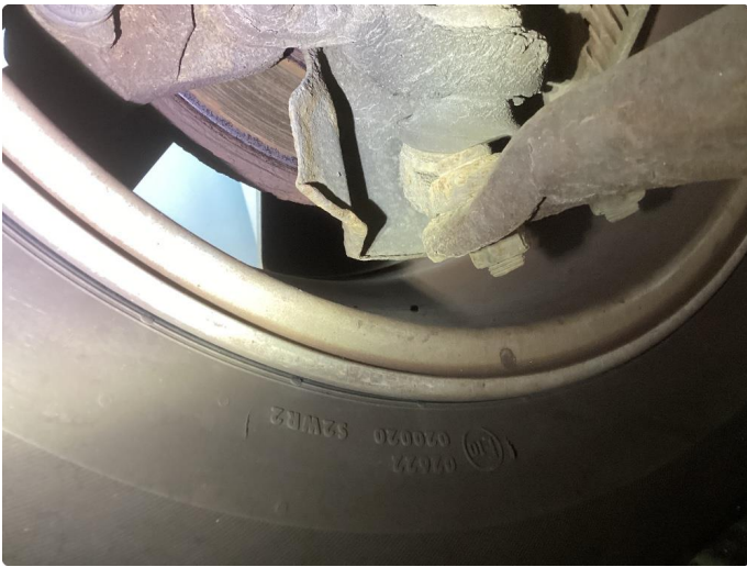
2.1 Slitte bremseskiver foran, nok klosser