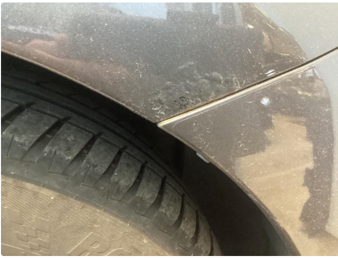
1.3 Rust höyre forskjerm