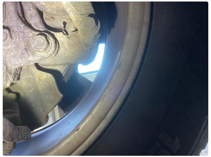
2.1 Slitte bremseskiver foran, nok klosser