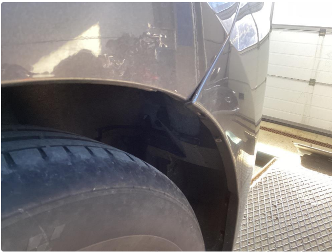
1.4 Skade stötfanger bak