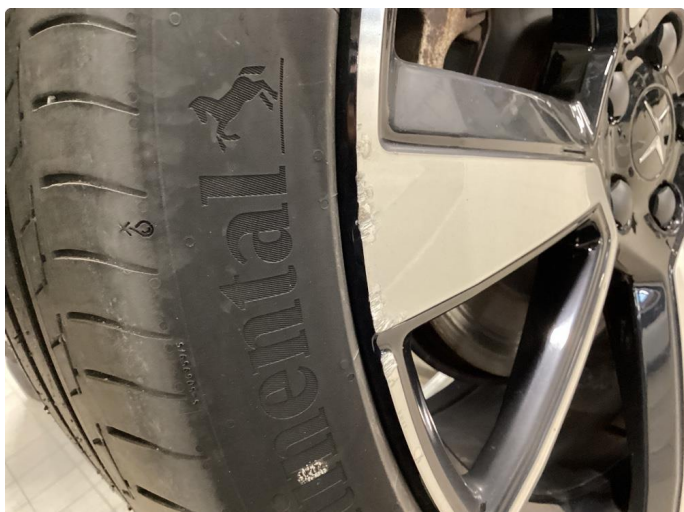
1.1 Skade på felg, normal slitasje ihht alder og km