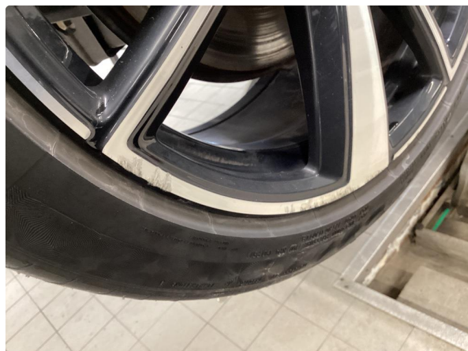
1.1 Skade på felg, normal slitasje ihht alder og km