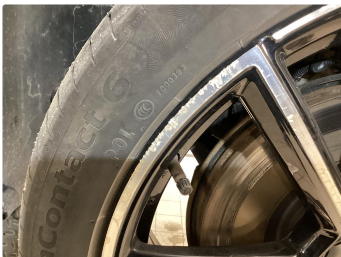
1.2 Skade på felg, normal slitasje ihht alder og km