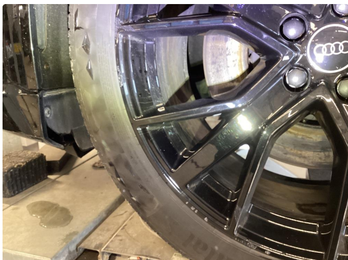
1.1 Kantkjørt felg normalt ihht alder og km