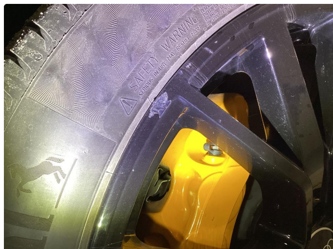
1.1 Kantkjørt felg normalt ihht alder og km