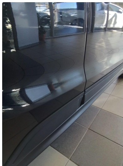
1.2 Liten park bulk