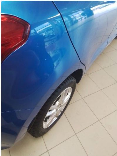
1.1 Liten park bulk