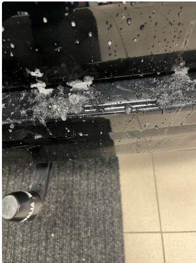
1.3 Små riper innlastning