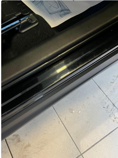
1.1 Små riper