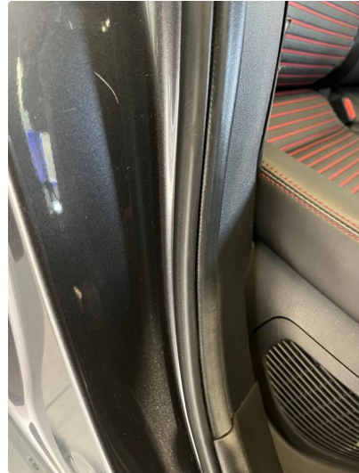
1.2 Liten ripe innside dørkarm høyre foran. lagt i lakk