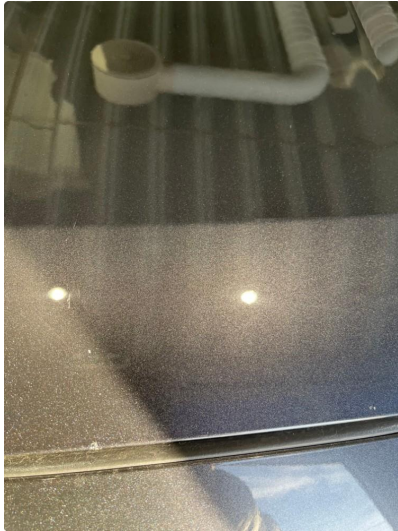
1.1 Liten stensprut. lagt i lakk