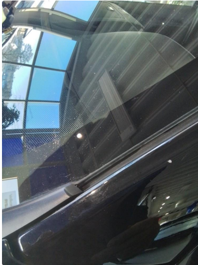
1.1 Liten stensprut. Lagt i lakk