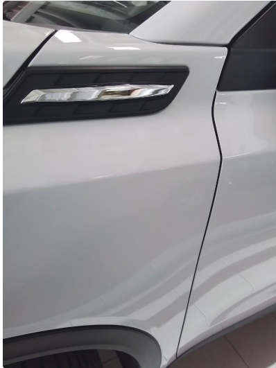
1.1 Liten parkering bulk