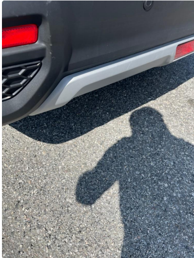
1.1 Små merker i plast/støtfanger bak