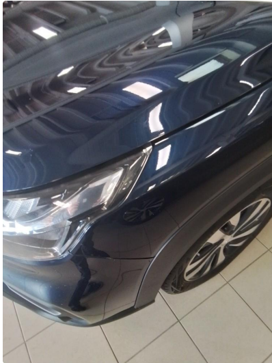
1.1 Små stensprut. Lagt I lakk