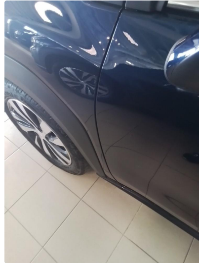
1.2 Liten park bulk