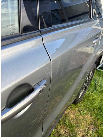
1.1 Liten park bulk