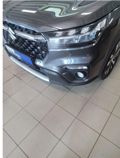
1.2 Små stensprut