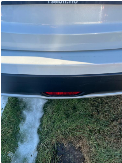
1.3 Lite merke bakfanger