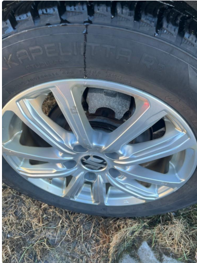
1.1 Merker på felg