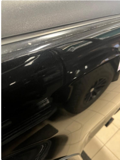
1.1 Liten bulk/Park bulk