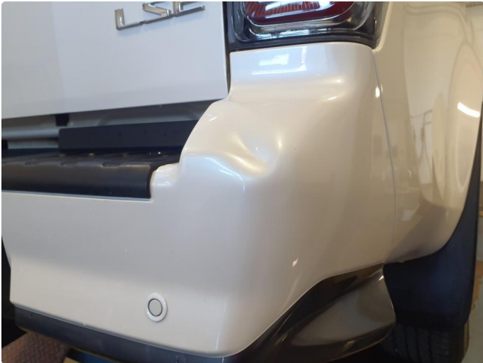
1.1 Bulk med lakkskade