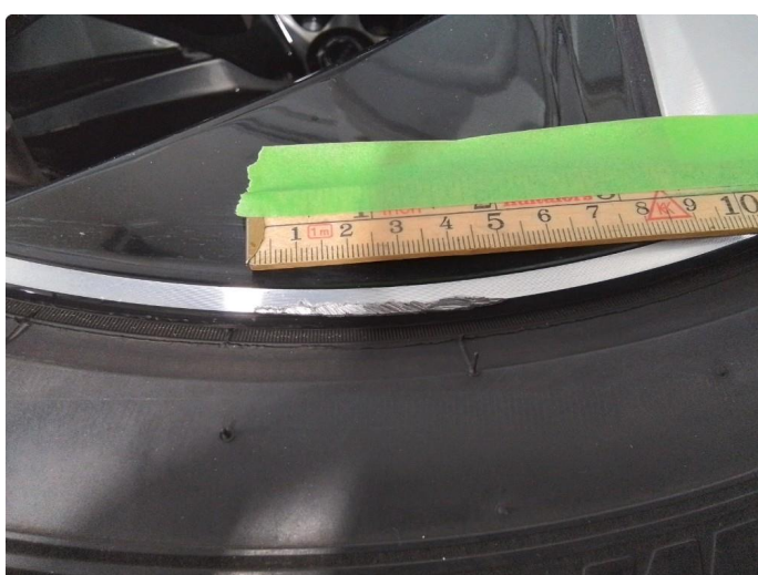
1.3 Kantkjørt felg