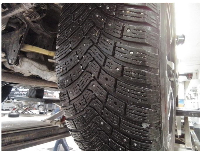
1.1 Lite pigger i dekk