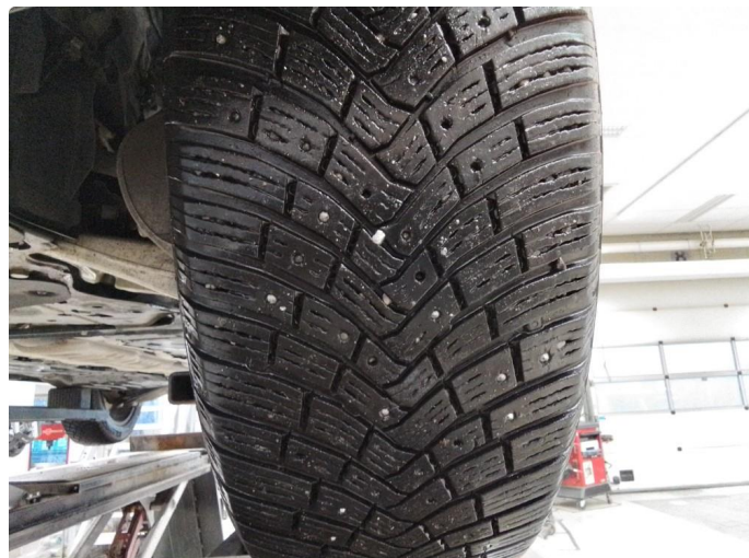
1.1 Lite pigger i dekk