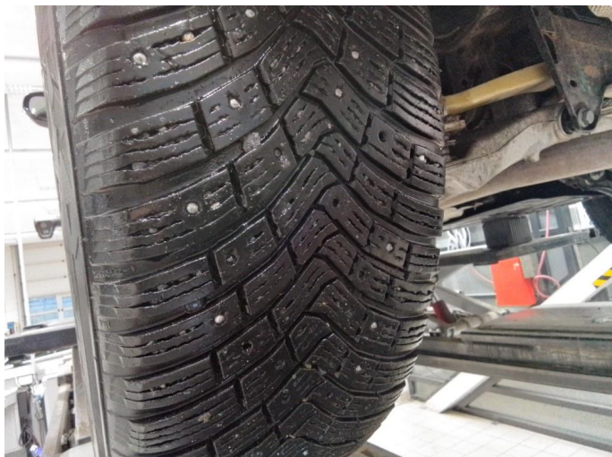
1.1 Lite pigger i dekk