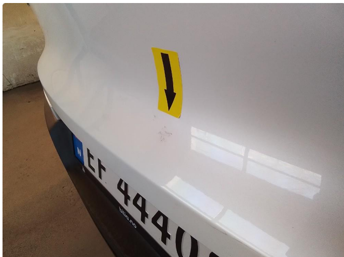
1.1 Lakk riper flekket ut