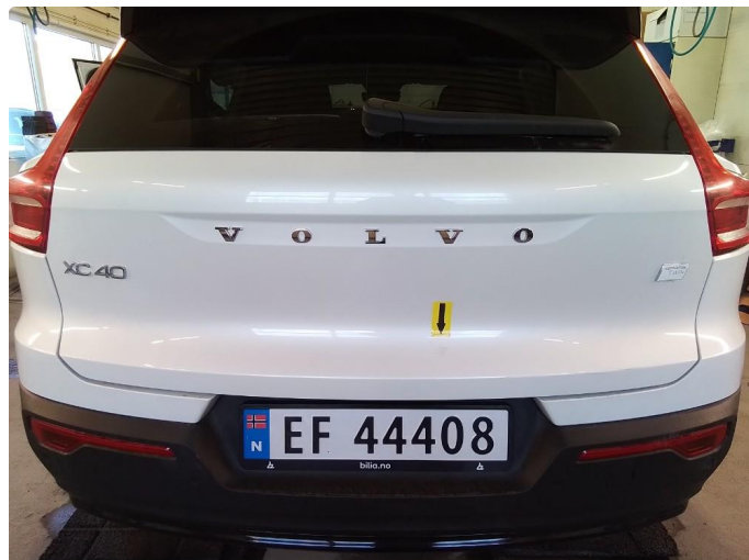
1.1 Lakk riper flekket ut