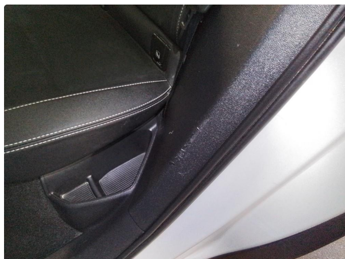
2.1 Små ripe(r)