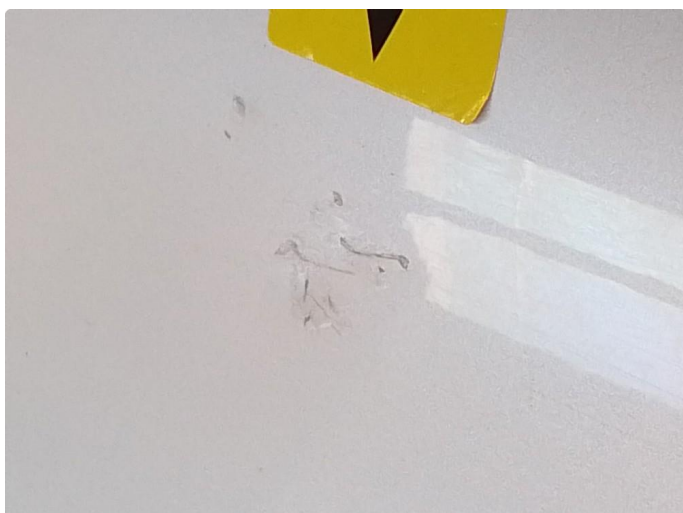
1.1 Lakk riper flekket ut