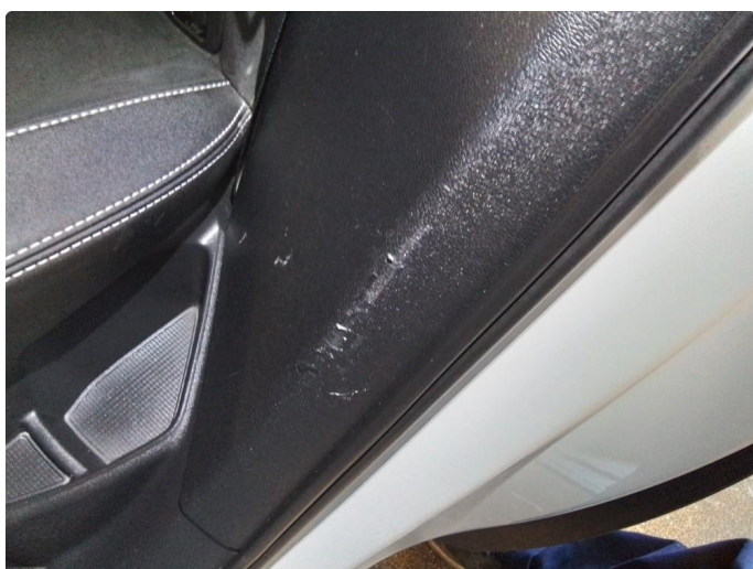
2.1 Små ripe(r)