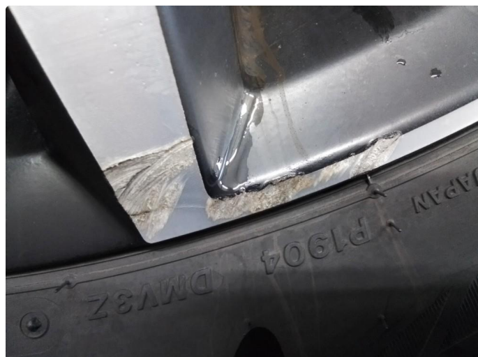
1.1 Kantkjørt felg