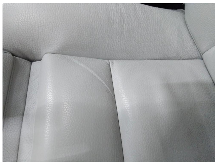
2.1 Liten flenge i setetrekk