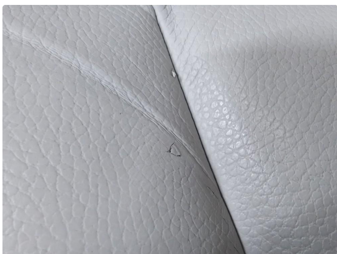
2.1 Liten flenge i setetrekk