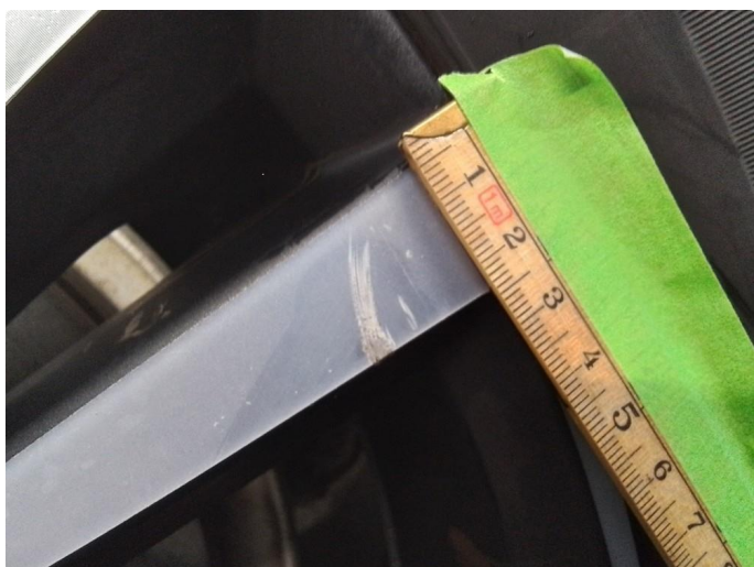
1.2 Kantkjørt felg