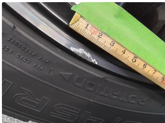
1.2 Kantkjørt felg