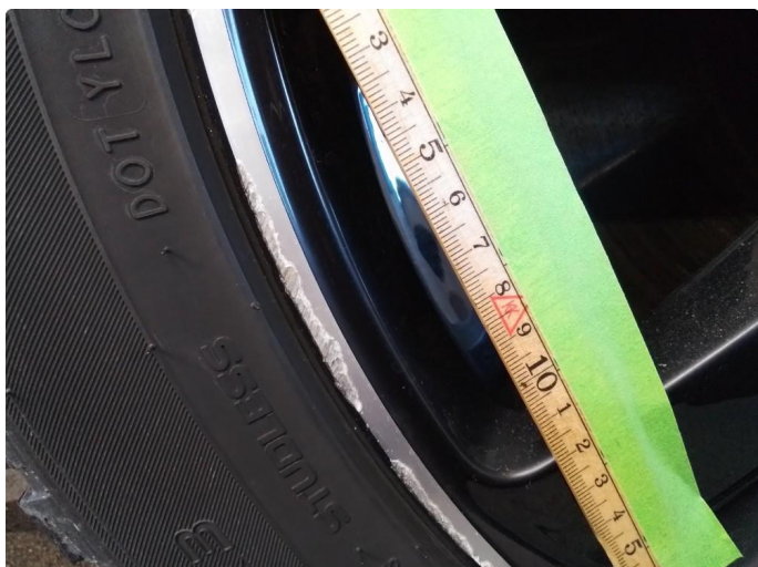
1.1 Kantkjørt felg