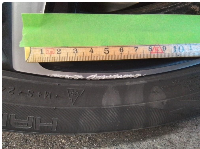
1.1 Kantkjørt felg