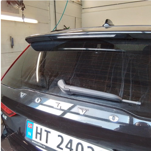
1.1 Noe ripete bakrute