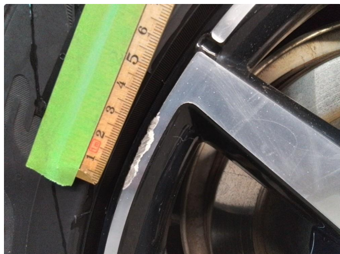
1.2 Kantkjørt vinterfelg