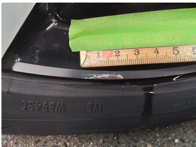
1.2 Kantkjørt vinterfelg