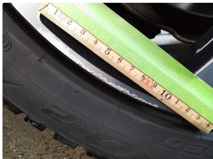
1.3 Kantkjørt vinterfelg