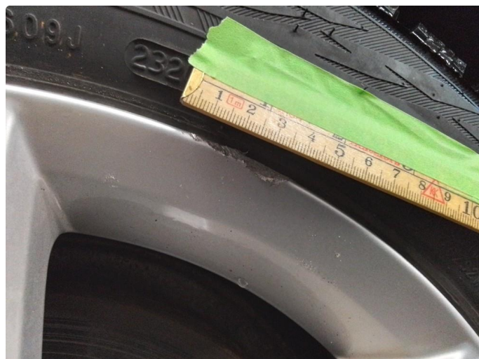
1.2 Kantkjørt felg