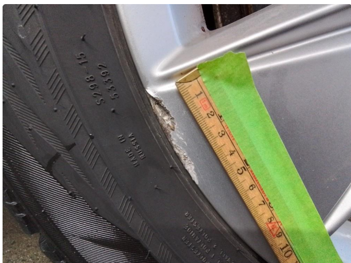
1.1 Kantkjørt felg